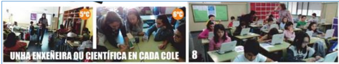
Figura 2. Fotos de talleres revista escolar Banzo colegio CEIP Pio XII.