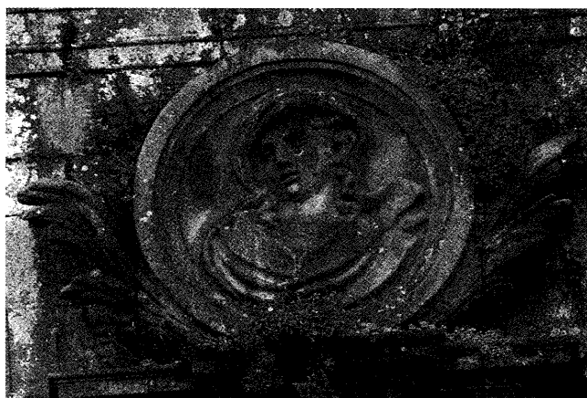
Fig. 13. María Magdalena. Fachada de la Azabachería.

Se trata, en fin, también, de una imagen realmente paradigmática de la Penitencia, tal como se imagina en el pensamiento contrarreformista 55 , lo que conlleva el perdón, tan vin-