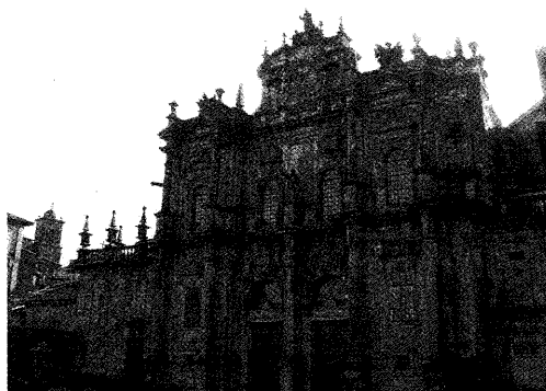
Fig. 11. Fachada de la Azabachería.

Las palmas sobre las que se disponen ambos medallones pueden entenderse en relación