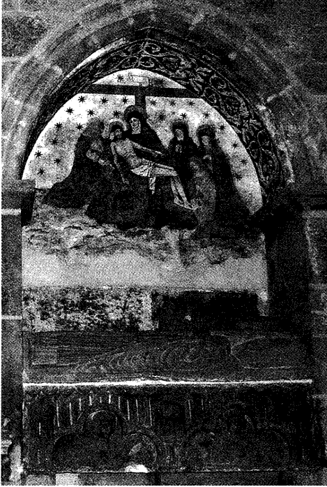
Fig. 4. La Lamentación sobre Cristo muerto . Capilla de Sancti Spiritus.

Alonso III de Fonseca. Se presenta, pues, a Magdalena asociada a las más señeras devociones de esta basílica compostelana.