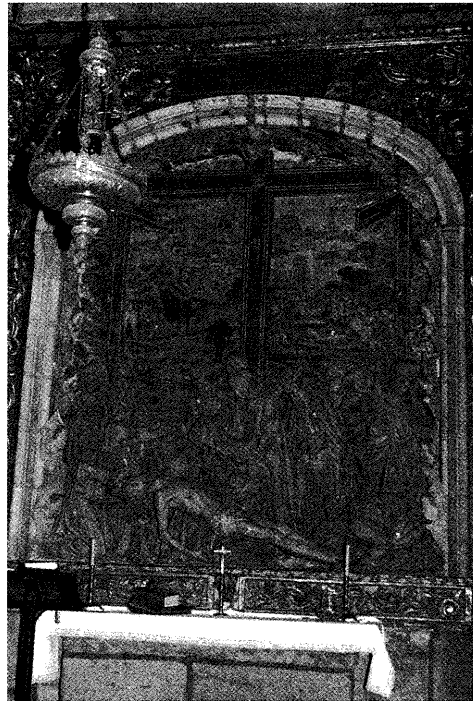
Fig. 5. La Lamentación sobre Cristo muerto . Capilla de la Piedad.

En la capilla de la Piedad, o de los Mondragón, presidida por otra Lamentación sobre Cristo muerto, concebida por Miguel Perrín 30 (fig. 5), la figura de la Magdalena está, si cabe, todavía más realzada 31 , aun cuando el modo