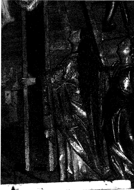
Fig. 8. María Magdalena. Detalle del Descendimiento de Cristo. Capilla de la Virgen de Prima.

El dibujo resultante del acuerdo capitular fija una serie de motivos a tener en cuenta. El Apóstol peregrino entre cuatro reyes, a vincular con el culto jacobeo, cubre un nivel de representación. En el espacio inmediatamente superior -sobre la hornacina dedicada a Santiago, en otro nicho que centra la peineta que se proyecta como remate de la construcción-, la traza presenta, proponiendo dos esculturas, el grupo del "Noli me tangere" 36 (fig. 10); de este modo Cristo resucitado se aparece a María Magdalena, escena sobre la que puede verse, en este caso, una representación, en relieve, de Dios Padre. Sobre la peineta en cuestión, una imagen de la Fe se encuentra acompañada, a los lados, por las figuras alusivas a la Esperanza y la Caridad 37 .