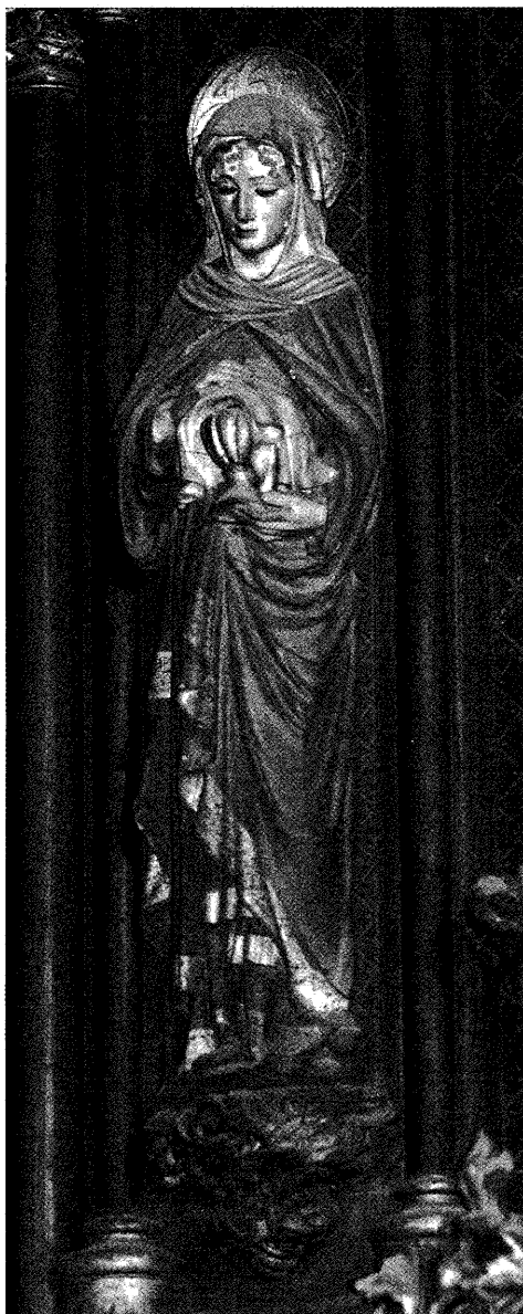
Fig. 14. María Magdalena. Retablo de la Capilla de Santa María a Blanca.

Por otra parte la asociación Pedro-María Magdalena a un lado de la Virgen, cabe entenderla en relación con el valor de la Penitencia, de hondo sentido contrarreformista, en tanto que, también, cabe mostrar un cierto paralelismo entre esta santa y Juan Bautista, tal como señala el retablo en cuestión dado que se ha entendido a este santo como "modelo de la vida ascética cristiana" 58 .