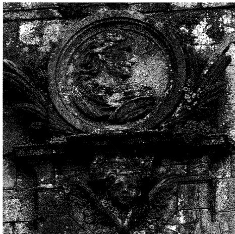
Fig. 12. Cristo resucitado. Fachada de la Azabachería.

con la Tierra Santa, lugar en el que se encuadra espacialmente el tema que nos ocupa; cabe recordar que se consideraba palmeros a aquellos que se encaminaban hasta allí y, de un modo particular, se vincula la palma con la propia figura de Jesucristo, vencedor de la muerte 47 .