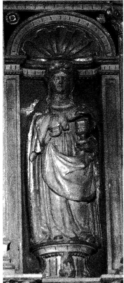
Fig. 3. María Magdalena. Retablo de la Capilla del Salvador.

entre el culto al Santísimo y a la Magdalena, a la que se llega a entender, incluso, como titular de esta singular capilla. En el programa iconográfico del retablo correspondiente 26 (fig. 2), a vincular con el propio Alonso III de Fonseca, se asocia la imagen de la Magdalena (fig. 3) a la del Santísimo, a suponer en el centro mismo del retablo, con los apóstoles Santiago el Mayor y san Juan, uno a cada lado, y, en una posición inmediata a ambos, la Virgen María, en el acto de la imposición de la casulla a san Ildefonso, devoción a vincular íntimamente con