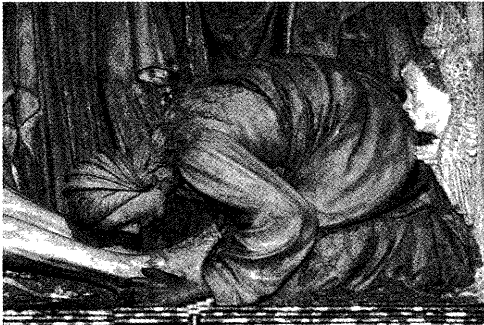
Fig. 6. María Magdalena . Detalle de la Lamentación sobre Cristo muerto. Capilla de la Piedad.

de valorar su figura (fig. 6) sea muy similar a la vista en la capilla de Sancti Spiritus. Es, en definitiva, la Magdalena presente en la Pasión, siguiendo el Nuevo Testamento, la que se nos muestra en estos casos, tratada, como no podía ser de otro modo, a partir del legado iconográfico que ha asociado su imagen a la del arrepentimiento y la penitencia, al vincularla, siguiendo a san Gregorio, como una misma persona, a la mujer arrepentida que perfumó, en casa de Simón, los pies del Señor 32 .