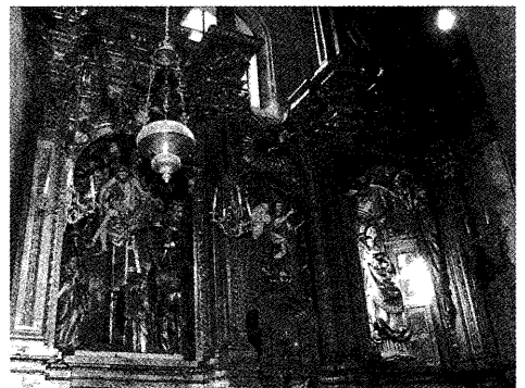
Fig. 7. Conjunto retablistico. Capilla de la Virgen de Prima.

Se trata, en definitiva, no sólo de rematar una portada sino también de completar un programa iconográfico concordante con lo que ya había sido concretado para los dos niveles inferiores, en donde, entre otros motivos, se había previsto la representación de las virtudes cardinales.