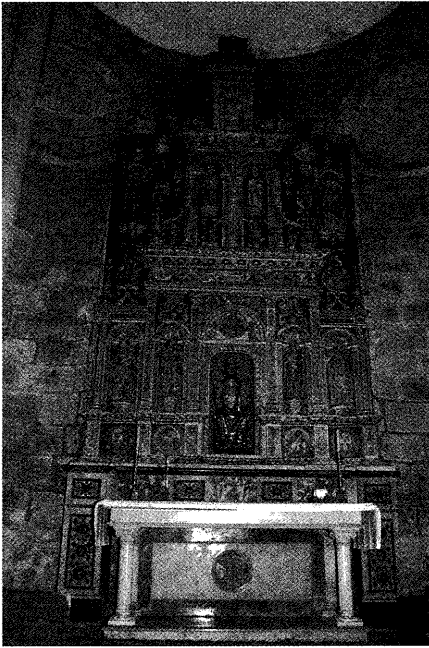
Fig. 2. Retablo de la Capilla del Salvador.

1603 y 1611: "...visité esta capilla, que vulgarmente llaman del rey de Francia, aunque su adovocación es de la Madalena... En esta capilla está siempre el Sanctissimo Sacramento en la custodia que está en el altar y en ella a los dos lados hay dos confesionarios... El dicho cardenal mayor y sus sucesores tienen obligación de poner en la dicha capilla un sacerdote lenguajero para que confiese a los peregrinos y otro que les dé el Sanctissimo Sacramento y ayude también a confesar, porque en esta capilla se confiesan y comulgan todos los peregrinos y romeros que de todas las naciones del mundo vienen a visitar esta Apostólica Iglesia de señor Santiago, y así hay en ella de ordinario gran concurso de peregrinos, mayormente los años del Jubileo. En esta capilla el dicho cardenal mayor da a cada peregrino un buleto de cómo vinieron a romería a esta Sancta Iglesia y de cómo confesaron y comulgaron en ella..." 25 .