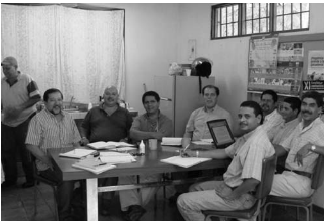
Comité Técnico de Investigación de Granos Básicos; ASA de Pejibaye, P.Z., Costa Rica. Mayo, 2008

El ASA de Pejibaye está conformada por 5 funcionarios –el que la dirige es ingeniero agrónomo– quien se concentra en la estrategia de interacción con otras instituciones y organizaciones locales, en la aplicación de políticas agropecuarias y rurales que el MAG ejecuta en la región y a nivel nacional. Entre sus funciones están la gestión de proyectos, promoción de actividades y su financiamiento, facilitación de múltiples reuniones y fomento de la participación de grupos de productores y de mujeres; esta zona tiene 4.000 km 2 donde la agricultura y la ganadería son las principales actividades. El director de esta ASA es también el encargado de granos básicos en la región. (Benavides, 2008).