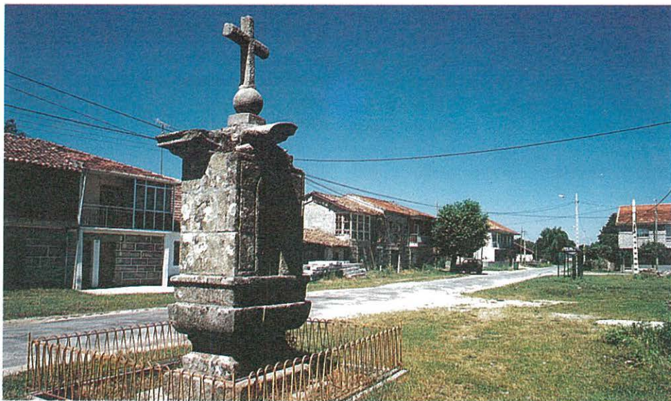
Un peto de ánimas en A Sainza