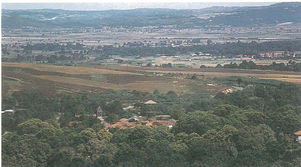
Un bello "souto" rodea la aldea de Crespo que domina la planitud de A Limia

municipio y el de Porqueira. Su afluente más importante, el río Bidueira, que cruza el municipio de norte a sur, es muy aprovechado para el regadío y para la práctica habitual de la pesca de la trucha.