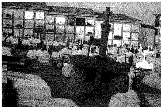
Foto 1. Tumba del “regueifeiro” Pena con forma de dolmen sencillo con crucero en el cementerio coruñés de San Amaro.