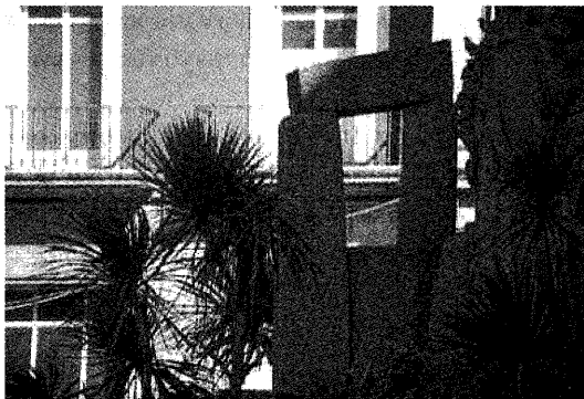
Foto 2. Trilito de la parte posterior del monumento a Curros Enríquez en los jardines de Méndez Núñez de La Coruña.

Es posible que esta construcción tenga cierto grado de inspiración o de convergencia, al menos, con la ideología, que se expresa en el monumento a Curros Enríquez, construido por Asorey en los jardines de Méndez Núñez en La Coruña, dando la espalda al próximo edificio de la Diputación Provincial, pues en el poeta aparece representado en pie con una lira como “bardo” céltico y cantor de la raza gallega, que aparece personificada por hombres y mujeres realizando tareas de campesinos y marineros. En la parte posterior del gran conjunto escultórico hay tres trilitos, que incluso podrían estar inspirados en el gran monumento megalítico británico de Stonehenge, en los que vuelve a manifestar la idea de que este tipo de construcciones está vinculado con el celtismo. Como quiera que la tumba de Pena es posterior al monumento a Curros, es muy probable la influencia de éste sobre aquél, pues a mayores están en la misma ciudad (Foto 2).