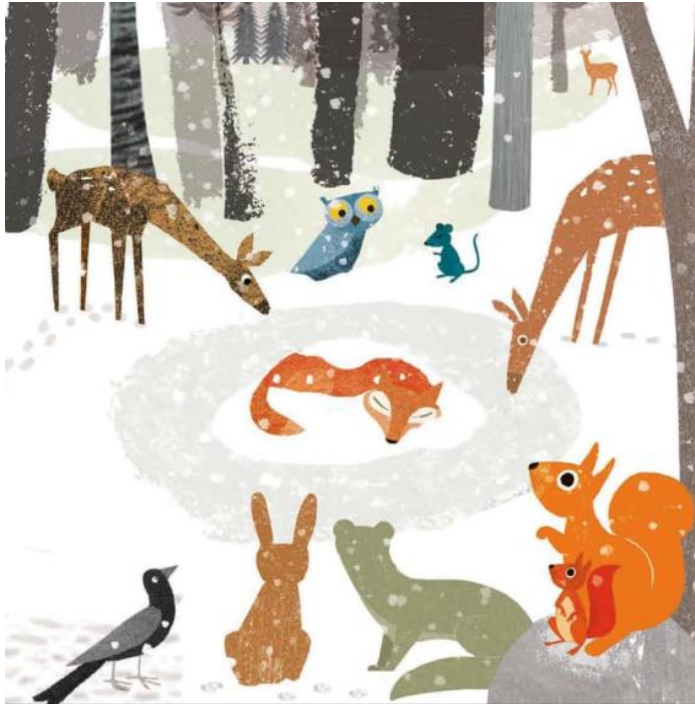
Figura 5. Imaxe sobre a morte do raposo cun tempo nivoso

Fonte: álbum ilustrado El árbol de los recuerdos (Teckentrup)