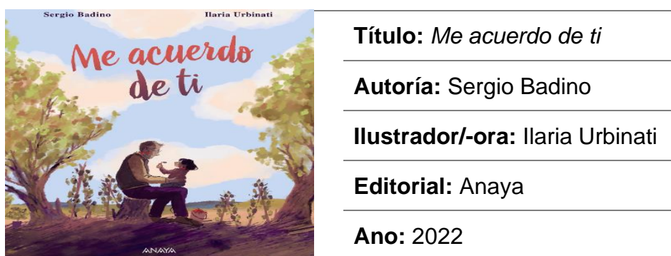
Táboa 6. Ficha técnica da obra Me acuerdo de ti

Me acuerdo de ti é un álbum ilustrado escrito en primeira persoa por un dos protagonistas, o avó. A través desta historia podémonos introducir no pensamento deste personaxe, o cal fabula tras coñecer que ten unha enfermidade de perda da memoria. Neste senso, realiza un percorrido no tempo desde que naceu a súa neta e a colleu en brazos, todos os momentos vividos con ela como as viaxes ao parque ou o coidado das plantas até o día que ela é maior e el xa non está. O relato finaliza co avó imaxinando como a súa neta observa a fotografía de cando ela naceu, dicindo as seguintes palabras textuais “Hola, abuelo, me acuerdo de ti”. Na Táboa 6 pódese consultar a ficha técnica.