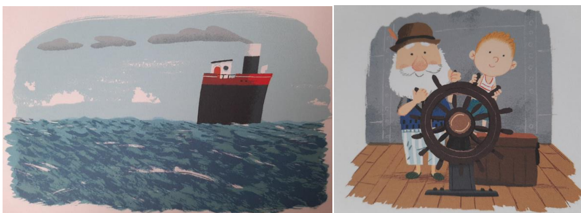
Figuras 1-2. Imaxe da viaxe de Leo e o seu avó á illa

Fonte: álbum ilustrado La isla del abuelo (Davies)