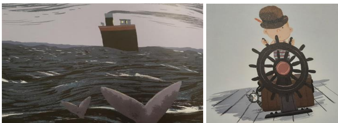
Figuras 3-4. Imaxe do retorno de Leo a casa sen o seu avó