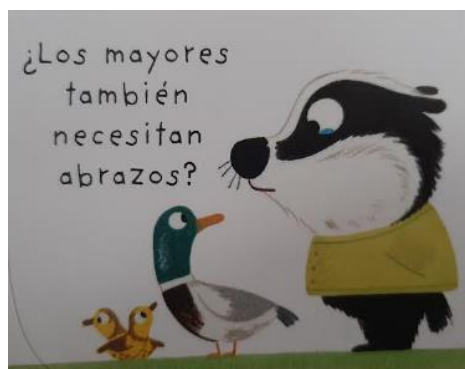
Figura 10. Imaxe dun teixugo con bágoas nos seus ollos