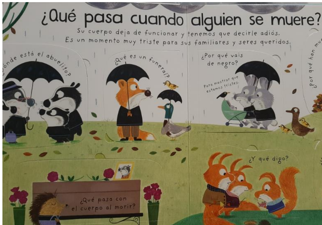
Figuras 8-9. Imaxes sobre o tempo atmosférico (chuvioso e nivoso) ao tratar diversas cuestións sobre a morte