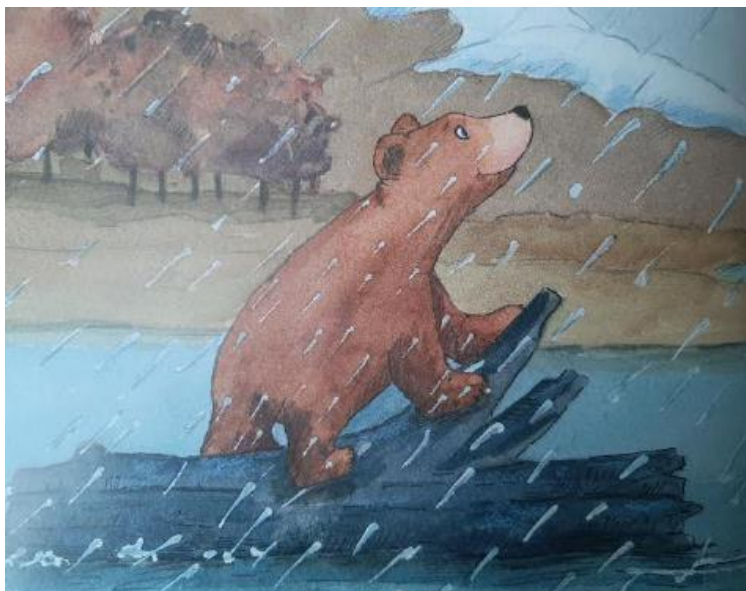
Figura 6. Imaxe de Osito recordando á súa nai por medio da choiva

Fonte: álbum ilustrado El árbol de los recuerdos (Teckentrup)