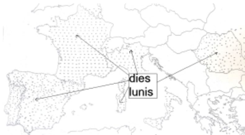
Mapa 2: Tipo DIES LUNIS