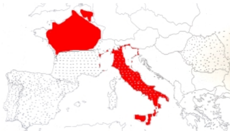
Mapa 4: Continuadores de LUNIS DIES: oil, it.