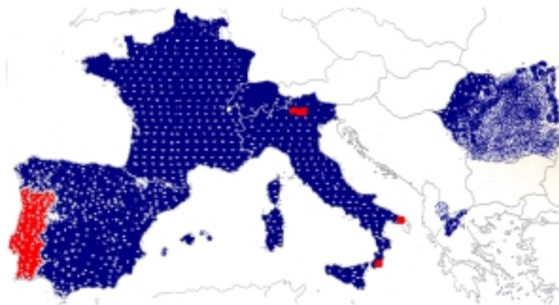
Mapa 1: Denominacións con base nos planetas / de orixe cristiá