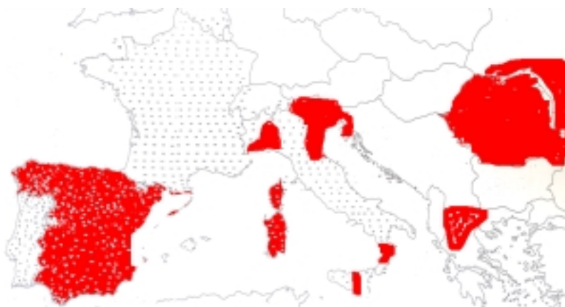
Mapa 5: Continuadores actuais de LUNIS: rom., occ., its., itm., sardo, esp., gal.