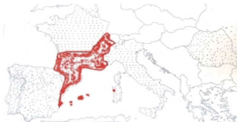
Mapa 3: Continuadores actuais de DIES LUNIS: cat., occ., fiprov.

No norte de Francia houbo unha progresión de lundi a costa de delun . A. Henry demostrou que lundi vai desprazando delun ata a imposición total a finais do XIV. Lundi introdúcese primeiro nos documentos de xente de cultura elevada, e delun vai quedando relegada ós textos que reflicten un medio cultural máis modesto. ¿Por que esta substitución? Probablemente por influencia francona: o xermánico tiña a mesma orde (cfr. al. Montag , Dienstag ..., onde -tag = 'día').