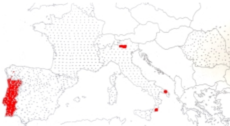
Mapa 6: Denominacións de influencia eclesiástica.

ou o domingo) no portugués (con algúns restos no galego), nalgunha zona do Friuli e no grego do sur de Italia ( vid. Mapa 6).