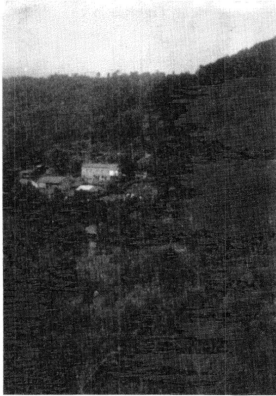
Jaguaza: Barrio de Ferradal