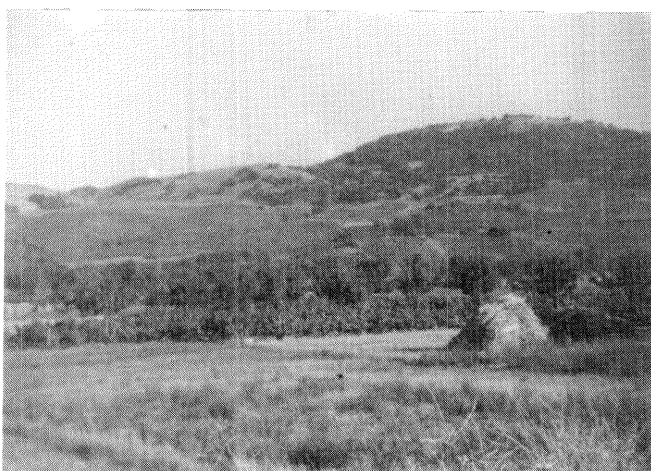
Aprovechamiento del terrazgo en Pacios (Jaguaza)