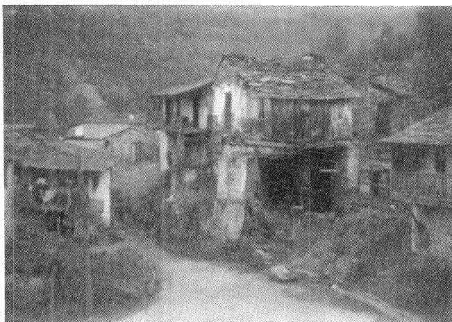
Jaguaza: Barrio de Pacios