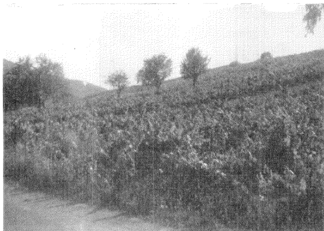
Viñedo de Jaguaza