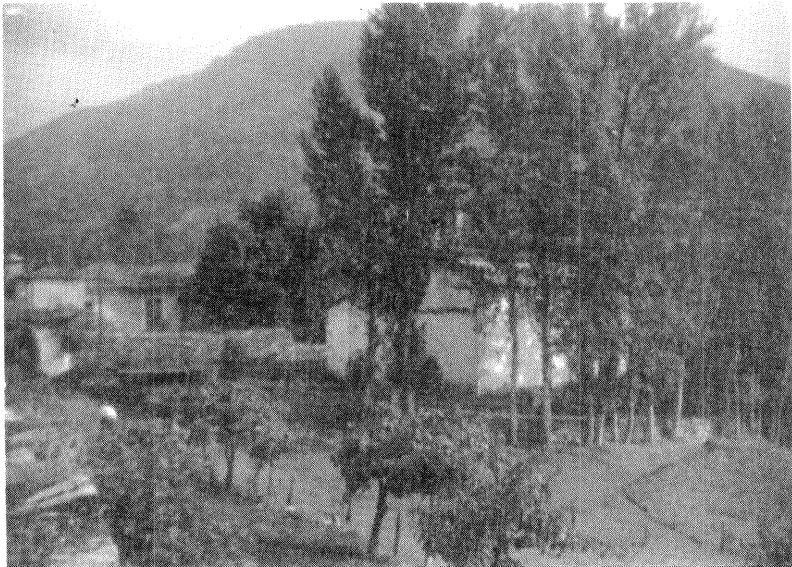
Iglesia de San Miguel (Jaguaza)