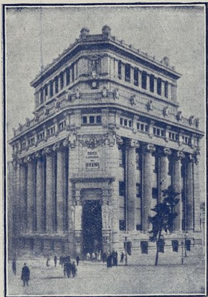
Edificio de la Sucursal en Madrid