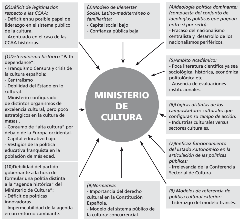
Fig. núm 3. Factores exógenos que configuran el Ministerio de Cultura