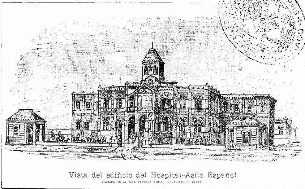
Vista del edificio del Hospital-Asilo Español

GRABADA EN LA ESTADA VASQUEZ CORES, DORNALICHE Y REYES