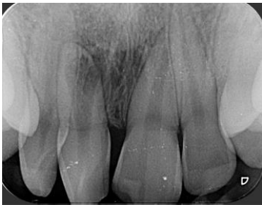
Imagen 3: radiografía en la cual se aprecian las finas paredes radiculares del 11, así como, una gran comunicación con el espacio perirradicular.