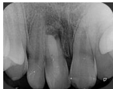
Imagen 6: radiografía donde se aprecia el tapón apical.