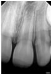
Radiografía en cita de revisión, en la cual se aprecia radiolucidez periapical.