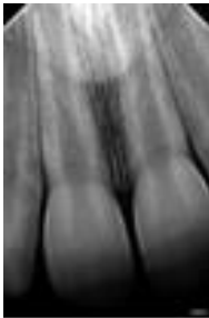
Radiografía primera cita donde se aprecia el desarrollo radicular incompleto con paredes finas y ápice abierto.

Al examen radiográfico se aprecia resolución de la patología periapical, así como una continuación del desarrollo radicular, consiguiéndose el crecimiento en longitud y grosor de las paredes radiculares y también el cierre apical. Se consigue a su vez, una respuesta positiva al test de sensibilidad de frío.