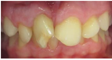
Imagen 1: fotografía intraoral donde se aprecia el cambio de coloración en el diente 11.