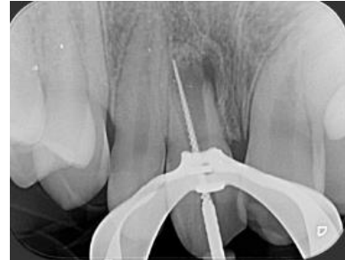
Imagen 4: determinación de longitud de trabajo mediante lima K.