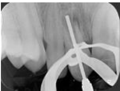
Imagen 5: colocación y condensación del Biodentine®.