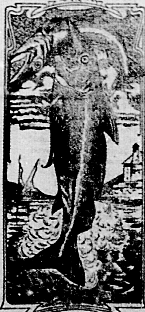
La última palabra

Emulsión "Dos pescados" (Marca registrada.)