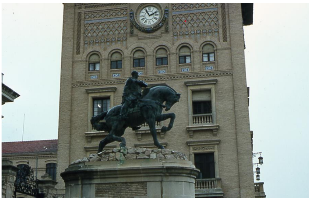
Fig. 24. Moisés de Huerta, boceto estatua ecuestre do Xeneral Francisco Franco, ABC , 1 de Outubro de 1944. [Fotografía].