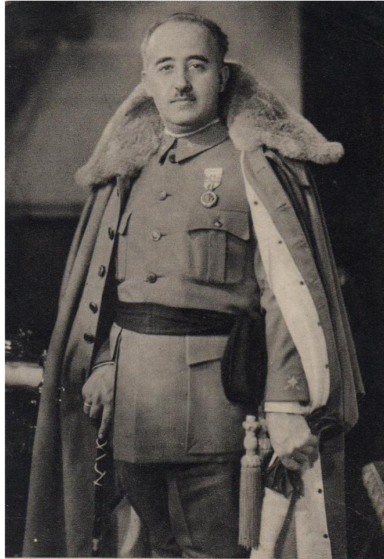
Fig. 6. Anónimo, Retrato de Franco , ca.1938. [Pintura].