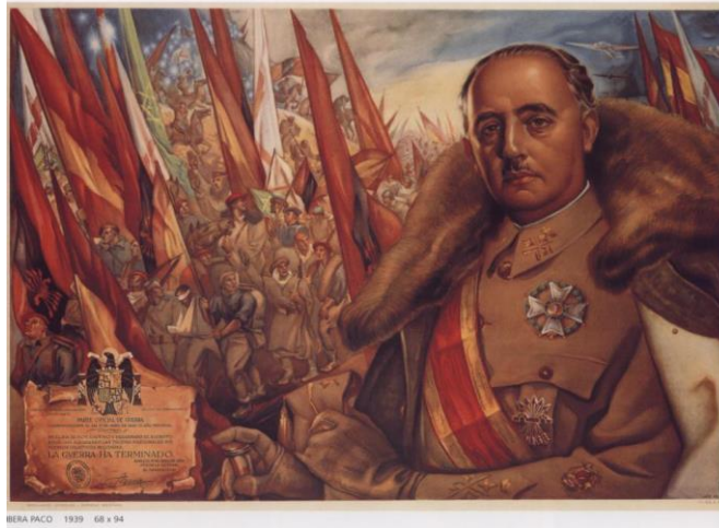
Fig. 12. Servizo Nacional de Propaganda, Generalísimo Franco , ca. 1939. [Cartel]. Recuperado de: Llorente Hernández, A., 2002: p. 51