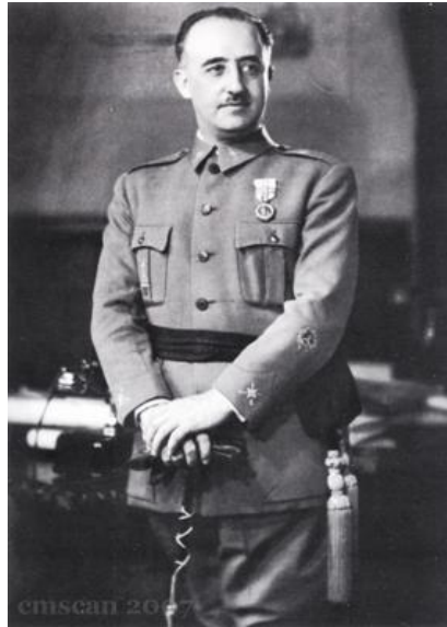
Fig. 2. Anónimo, Francisco Franco. El colegio Champagnat de Buenos Aires, Argentina, a los cruzados de la causa de Franco , Buenos Aires, 1937. [Fotografía]. Recuperado de: Donet Donet, L. 2013: p. 21