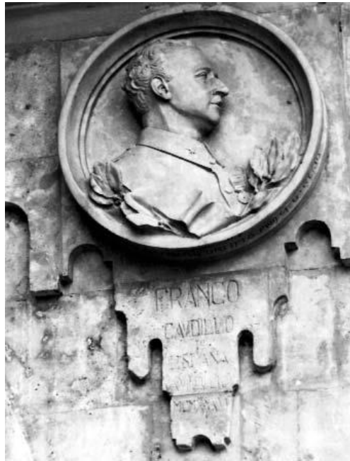
Fig. 8. Georg Kolbe, General Franco , 1938. [Escultura]. Recuperada de: https://commons.wikimedia.org/wiki/File:Kolbe-Franco.png