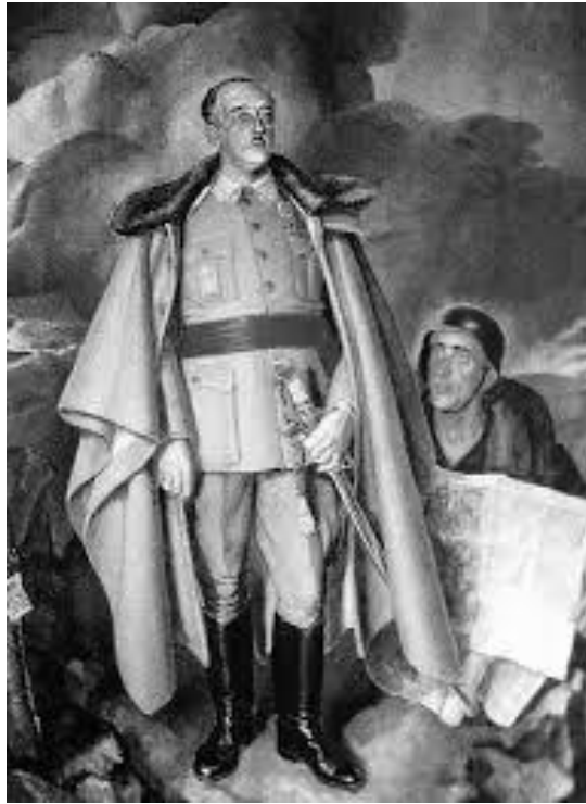
Fig. 14. José Aguiar, Francisco Franco , 1939. [Plano detalle mapa].