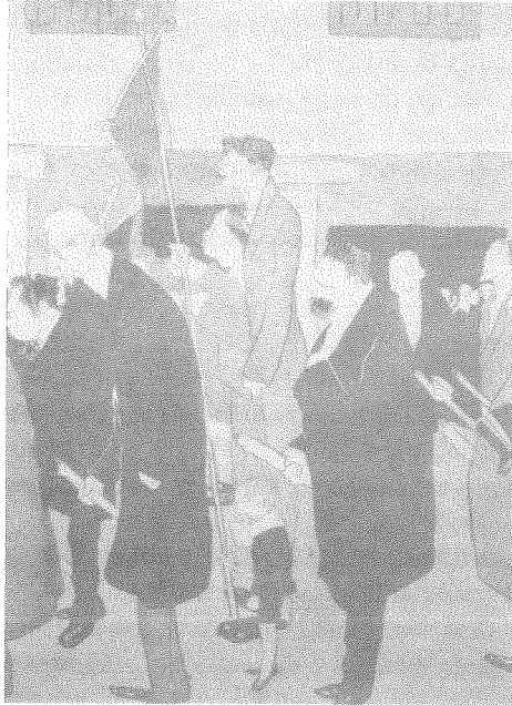
1. Capa do Album de autocaricaturas , entre 1903 e 1908.