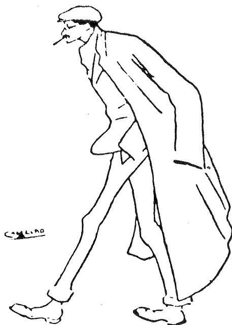
9. Autocritadura, Vida Gallega , I-1909.