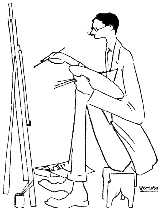
10. Autocritadura, Almanaque Gallego , 1910.