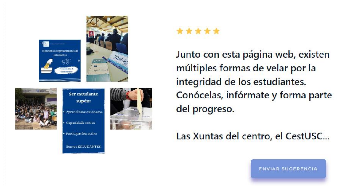
Figura 9: Apartado de participación