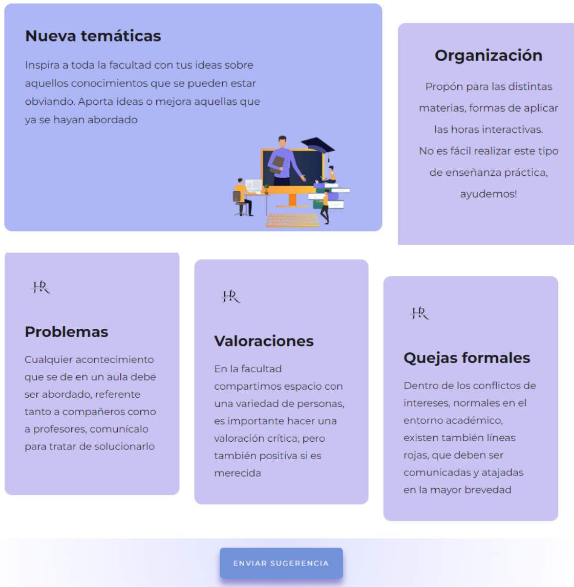
Figura 7: Apartado de docencia