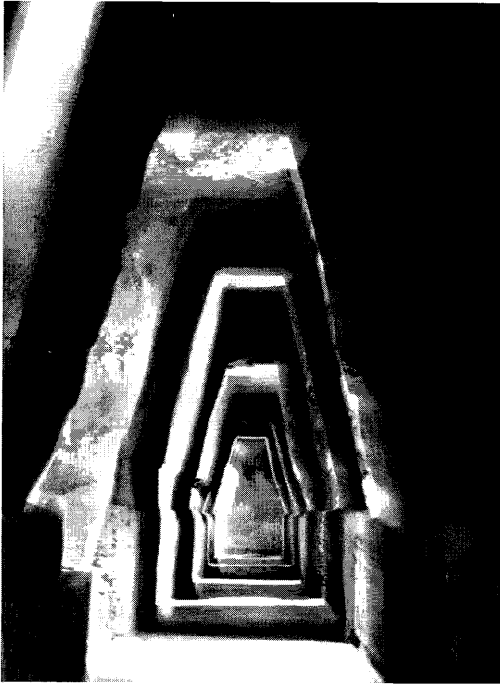
Cueva de la sibila cumana, Cumas, Nápoles (Mimmo Jodice).