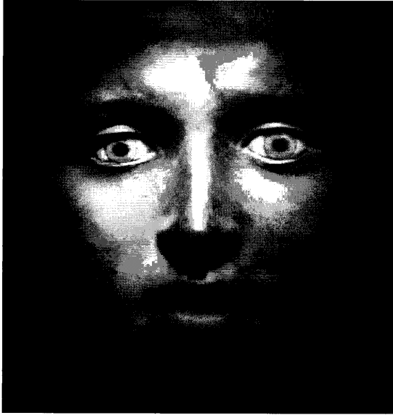
Escultura Romana de Bronce, Museo Arqueológico Nacional de Herculano, Nápoles (Mimmo Jodice).

incluso cuando se fija como objetivo justo el de preservar. Pretender el absoluto anonimato técnico, renunciando a la elección crítica del modo de intervenir, sería absurdo desde el punto de vista científico. Ningún médico renunciaría al derecho-deber de elegir la técnica de intervención más idónea para curar a un enfermo en base no sólo al diagnóstico, sino también a la propia convicción terapéutica. La relatividad es epistemológicamente intrínseca a muchos campos del saber, y de forma concreta a aquellos que se extienden a la operatividad.