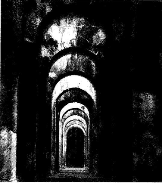
Cisterna Romana, Bacoli, Nápoles (Mimmo Jodice).