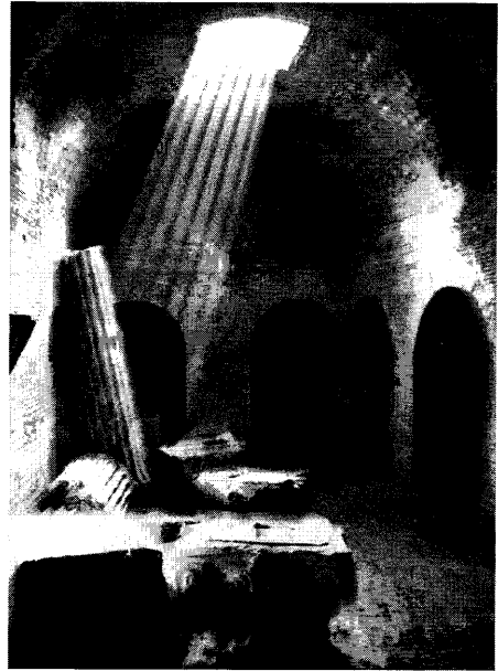
Anfiteatro Flavio, Pozzuoli, Nápoles (Mimmo Jodice).

por otro lado, es un proceso ya in fieri por lo que se refiere a los recursos territoriales y urbanos. Al menos en Europa, después de los derroches ambientales del pasado más reciente, se ha impuesto a la atención de la crítica más avezada la necesidad de poner un freno a las expansiones constructivas inmotivadas para incentivar en sentido contrario programas de recuperación y de revalorización de los tejidos urbanos preexistentes. Y debe ser así porque el propio territorio es un recurso precioso, además de estar limitado y no ser reproducible.