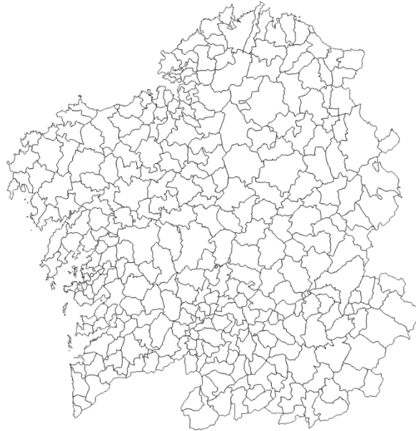
Figura 3. Mapa de Galicia. Obtido do Servizo Galego de Saúde (2024)