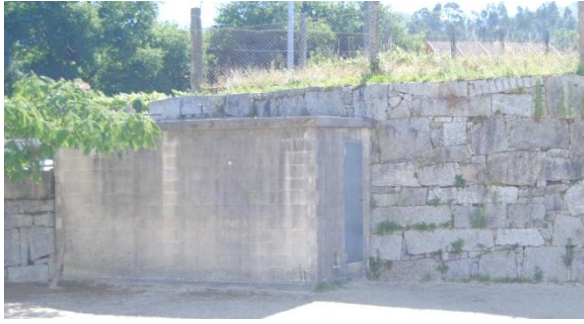
Figura 23. Lateral da caseta . Elaboración propia.