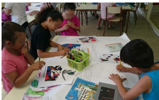
Figura 6. Realización mural. Elaboración propia.

Por iso a segunda vez que realicei esta actividade co alumnado de segundo curso do colexio Pepa Colomer no Prat de Llobregat, en Barcelona, incluín este apartado na realización da proposta. Os nenos traballaban por grupos e cada equipo centrábase nun artista do que despois facían un mural para mostrarllo e explicarllo ó resto.