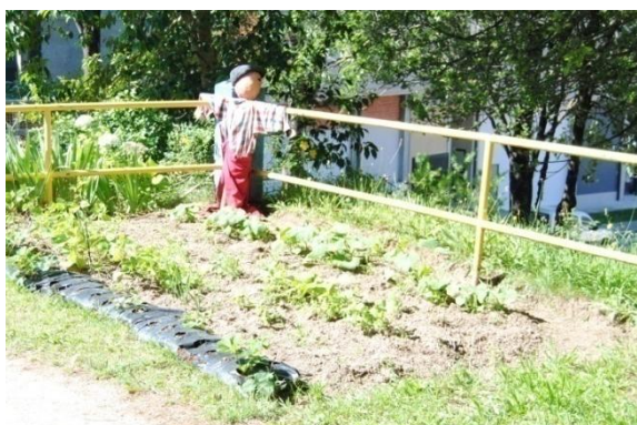
Figura 11. Horto do colexio . Elaboración propia.

O patio do colexio xa conta cun pequeno horto e cun pequeniño invernadoiro tamén pero en canto á zona do horto, no patio de infantil hai unha zona nun dos laterais de terra que non se emprega para nada actualmente e que penso que se podería utilizar para tamén como zona de plantación no patio, pois a partir nestes espazos trabállase moi ben cos pequenos conceptos relacionados cos cultivos, a vexetación e demais dunha forma lúdica e amena e que a eles e elas lles gusta moito. Son lugares nos que se une a teoría e a práctica.