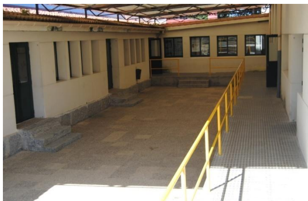
Figura 10. Patio cuberto central . Elaboración propia.

Para completar este espazo faría dous bancos cómodos e dúas mesas con rodiñas cuns cantos palés (que é un material moi barato e accesible) e colocaría unhas cantas esterillas na biblioteca para que así os nenos que queiran poidan xogar a xogos de mesa, deitarse a ler un conto ou charlar simplemente no seu “bosque imaxinado”.