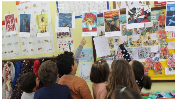
Figura 1. Museo na aula. Elaboración propia.

Unha primeira sesión dedicouse a que eles expresasen o que entendían por estas 8 emocións para ver do que se partía e completar aquilo que fixese falta. Unha segunda sesión foi destinada a recrear un pequeno museo na aula con cadros que eu previamente escollera (no que procurei que estivesen representados diferentes artistas de cada época e estilo e tamén que representasen algunha das emocións que quería traballar con eles) e na que eles deberían ir indicando que sentimento lles transmitía cada un deles.