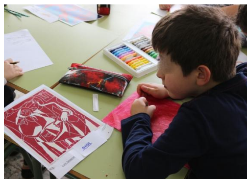
Figura 5. Reprodución dos cadros. Elaboración propia.