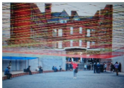
Figuras 15 y 16. Intervencións do colectivo Cuarto Creciente en Ludantia (2016) .

http://tv.campusdomar.es/video/5846e0e11f56a8435b363253