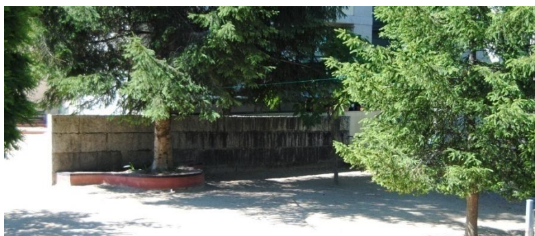
Figura 22. Corda entre as árbores. Elaboración propia.