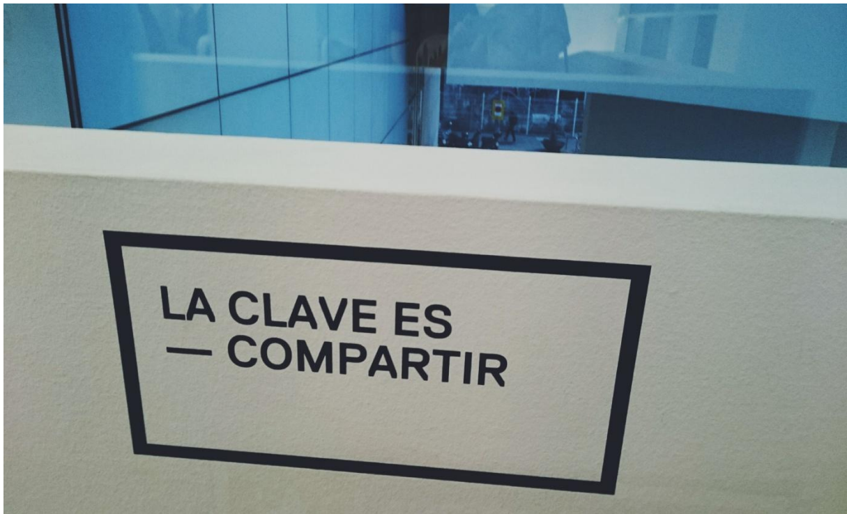
Fotografía. Intervención no MACBA durante a exposición "Especies de espacios" (2015).