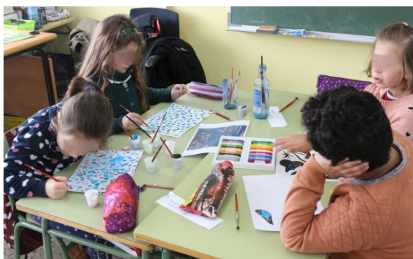
Figura 4. Reprodución dos cadros. Elaboración propia.