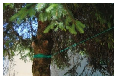
Figura 21. Corda. Elarabación propia.

Outra proposta é na zona das árbores, tensar un par de cordas duns ós outros nas súas ramas máis altas e colgar dende estas pequenos obxectos como cunchas, pedriñas, cascabeis etc, formando unha especie de móbiles sonoros colgantes que os días que faga vento producirán diferentes sons.