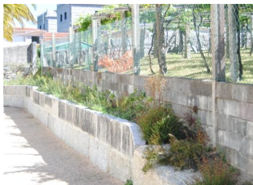
Figura 12. Zona para plantación . Elaboración propia.