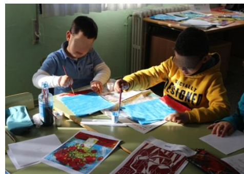
Figura 3. Reproducción dos cadros. Elaboración propia.