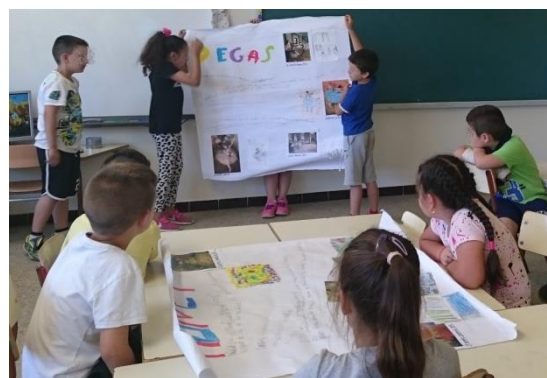
Figura 7. Exposición do mural.

Un aspecto negativo que detectei despois de realizar ambas actividades foi a simplificación que facía eu da educación artística ó reducir as artes só a pintura, pois tanto na primeira coma na segunda realización da actividade o análise era só sobre cadros, non introducín máis formatos nin tipos de imaxe perpetuando ou