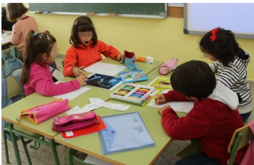
Figura 2. Reproducción dos cadros. Elaboración propia.

Na terceira sesión cada un deles escolleu un cadro e fixo a súa propia representación del, tratei de que cada un utilizase diferentes técnicas e materiais ofrecéndolles diferentes opcións (colaxe, esgrafiado, témperas, ceras brandas e duras, empregando só tonalidades frías...) e xa para rematar unha cuarta sesión dedicouse a que con todo o traballado anteriormente, eles sós, na parte de atrás do debuxo escribisen finalmente aquela emoción que lles producía o seu cadro e que era o que esa emoción producía neles.