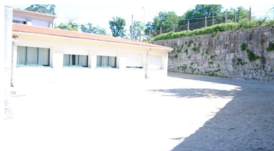
Figura 14. Espazo sen sombra . Elaboración propia.

Debido a que o patio de primaria apenas conta con vexetación e espazos cubertos, nos días soleados o alumnado non ten un espazo onde poder xogar a gusto, por iso sería interesante a creación de zonas de sol e sombra con anacos de teas en desuso, cintas de cores, paraugas vellos de cores que teñamos pola casa... (sempre que se poda utiliza material reciclado mellor), para que os raios do sol non incidan directamente nos nenos e nas nenas sen ter que tapar tampouco o teito do patio para elo.