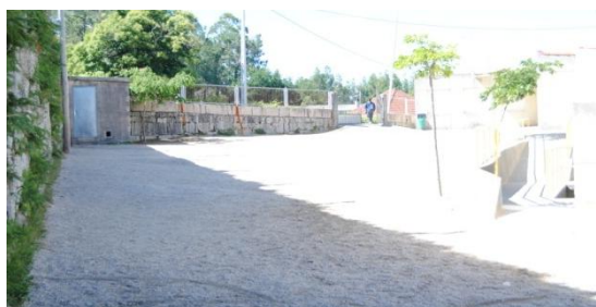
Figura 13. Espazo sen sombra . Elaboración propia.