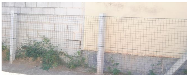
Figura 17. Enreixado . Elaboración propia.