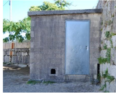
Figura 24. Fronte da caseta . Elaboración propia.

Estas serían algunhas das propostas para mellorar o espazo do patio do C.E.I.P. Amor Ruibal, o ideal como comentaba antes sería traballar con ideas que xurdisen directamente dos nenos e nenas e das súas propias demandas pero cómo neste caso non é posible, estas serían algunhas das miñas ideas para mellorar os espazos do patio, tratando sempre de empregar os recursos máis económicos posibles e de non facer separacións nos espazos entre os distintos cursos e ofertar diferentes posibilidades para que todos e todas teñan o seu sitio atendendo ás diferentes necesidades que hai.