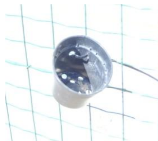
Figura 18. Maceta . Elaboración propia.