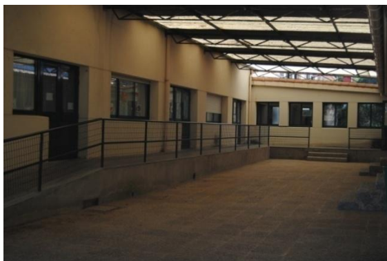
Figura 8. Patio cuberto da entrada . Elaboración propia.

facerse dano e empregar este espazo semiaberto e en desuso como aula de Educación Artística.