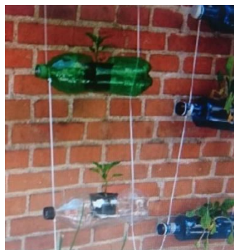
Figuras 19 e 20. Intervencións da guía do colectivo Basurama no documento "Como intervenir un patio escolar".(s.f.)

Outra proposta é na zona das árbores, tensar un par de cordas duns ós outros nas súas ramas máis altas e colgar dende estas pequenos obxectos como cunchas, pedriñas, cascabeis etc, formando unha especie de móbiles sonoros colgantes que os días que faga vento producirán diferentes sons.