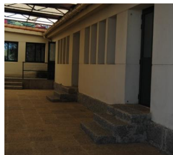
Figura 9. Patio cuberto da entrada . Elaboración propia.

Penso ademais que adecuando correctamente este espazo pode resultar moi bo, xa que é un lugar cunhas características especiais, que xoga un pouco coa idea de interior e exterior ó estar parcialmente cuberto pero non estar pechado de todo tampouco, podería servir un pouco como metáfora do que é a Educación Artística serve para romper barreiras.