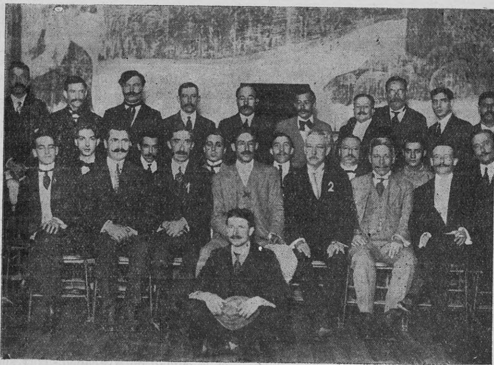
Visita del aviador Piñeiro (x) al "Centro Gallego de Avellaneda".