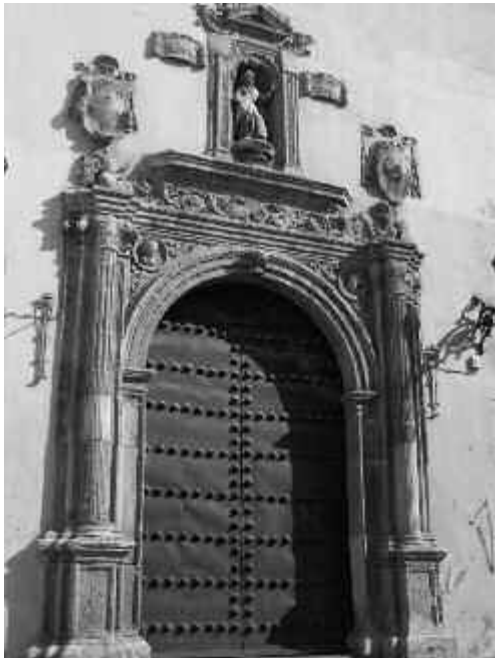
Fig. 4. Iglesia parroquial de San Matías.