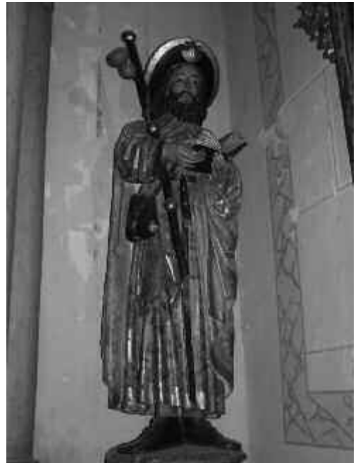
Fig. 5. Imagen de Santiago de la Iglesia parroquial de Santiago (s. XV).