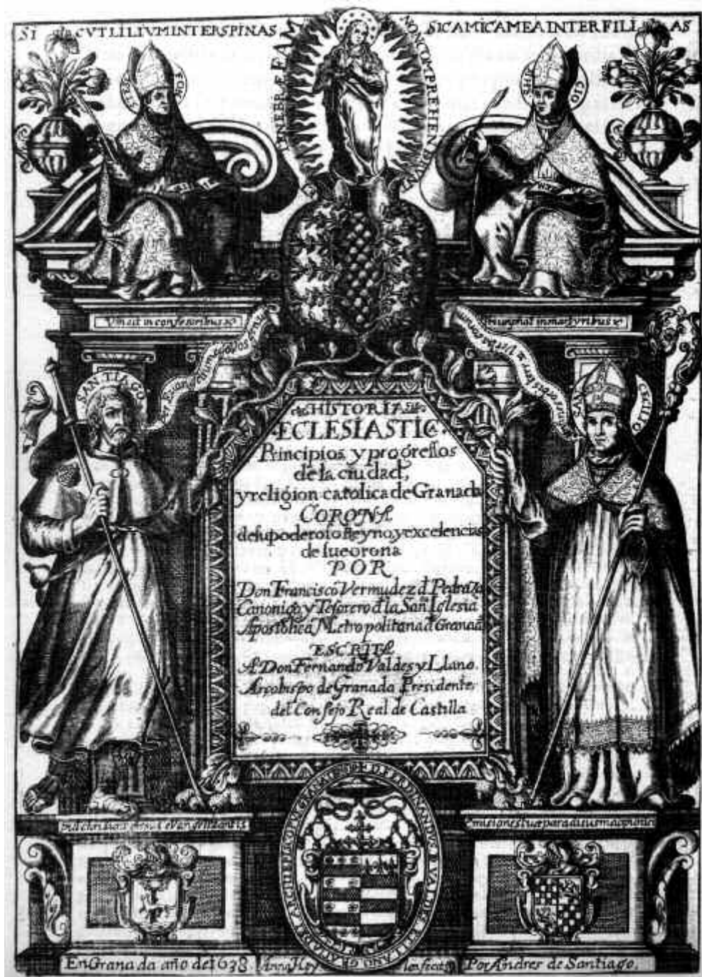
Fig. 6. Bermúdez de Pedraza, Fco.: portada de la Historia Eclesiástica de Granada (Granada, 1638) con las imágenes de Santiago Apóstol y San Cecilio, santos patronos fundadores de la ciudad, San Tesifón y San Hicso, santos mártires del Sacromonte, y la Inmaculada Concepción, principal definición dogmática de la época.