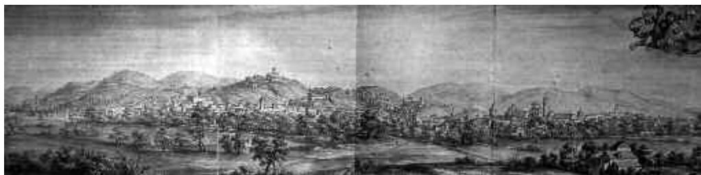
Fig. 1. Pier Maria Baldi: vista de la ciudad de Granada en 1668.