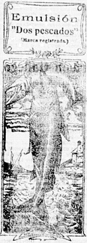
Emulsión "Dos pescados" (Marca registrada)

Me referimos a una nueva y excelente preparación de Emulsión "DOS PESCADOS" (marca registrada) la que contiene todas las extranjeras y españolas en calidad como en precio. Depositarlos por menor. Farmacia y Laboratorio de Iglesias. Farmacia, Droguería de Iglesias y Laboratorio.