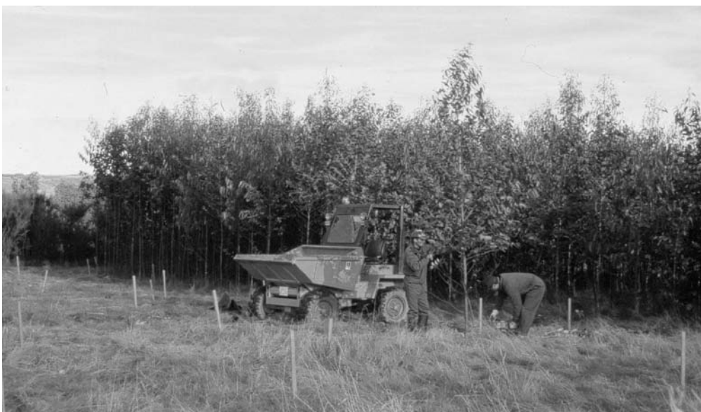
Foto 2.- Ensayos de diferentes cultivos de biomasa en los suelos de las escombreras de la mina de lignitos de As Pontes. Los resultados se encuentran sintetizados en la Tabla 6.