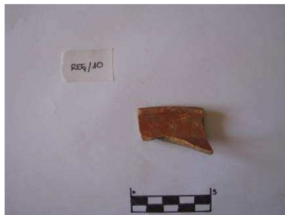
Figura 9. Fragmento de borde de sigillata encontrado en Las Regaderas.

mayoría de los restos aparentemente por su factura se tratan de terra Sigillata Hispánica aunque muy pocos fragmentos conservan el engobe típico de dicha cerámica. Igualmente, se encuentran fragmentos de materiales empleados casi con seguridad en la cocina, mucho más rústicos y poco cuidados en su apariencia.