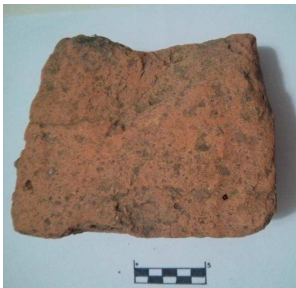
Figura 14. Fragmento de latericio hallado en Las Regaderas.