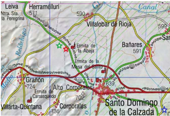
Figura 1. Mapa de la zona de Santo Domingo de la Calzada, donde se ha realizado la investigación. En verde la zona de Sansoto, en rojo la zona de Las Regaderas y en azul la zona de La Mesa de Irión.

diado, La Mesa de Irión, no existen hasta la fecha publicaciones al respecto.