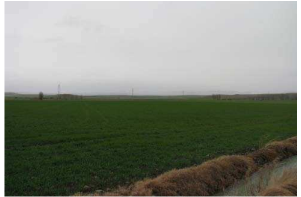
Figura 2. Vista general del emplazamiento de Sansoto.

Hemos de dividir nuestro trabajo en dos áreas; por un lado Sansoto-Las Regaderas y Las Abejas en la zona Oeste de Santo Domingo de la Calzada, que se han de poner en relación con el mencionado artículo del alfar de Sansoto del s. I d. C. (PAS-