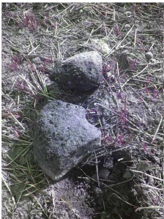
Figura 6. Fragmento de molino o meta hallado en La Mesa de Irión.