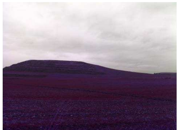
Figura 4. Vista general del emplazamiento de La Mesa de Irión.