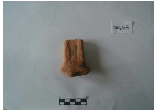
Figura 12. Fragmento de asa encontrado en Las Regaderas.