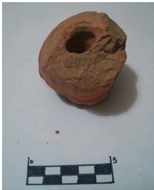
Imagen 7. Fragmento cerámico asociado a un soporte de vela. Las Regaderas.