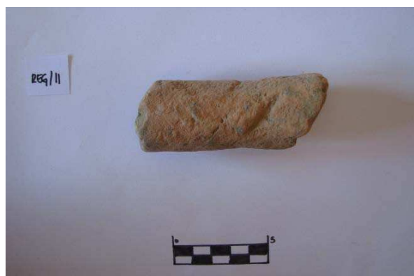
Figura 15. Fragmento cerámico con forma cilíndrica hallado en Las Regaderas.