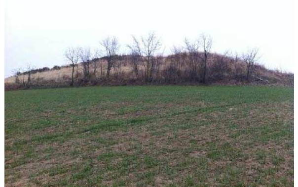
Figura 3. Vista general del emplazamiento de Las Regaderas.