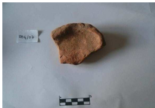
Figura 8. Fragmento de base cerámica recuperada en Sansoto.