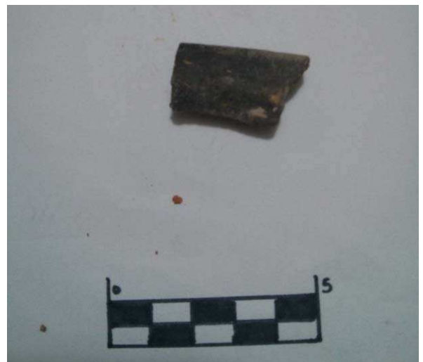
Figura 13. Fragmento de borde de cerámica de cocción reductora recuperado en Las Regaderas.