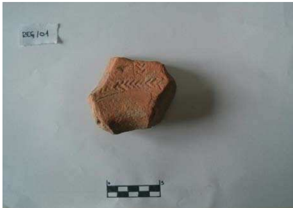
Figura 10. Fragmento de molde de sigillata hallado en Las Regaderas.

en la parte superior de la pieza contaría con algún otro tipo de decoración más detallistas.