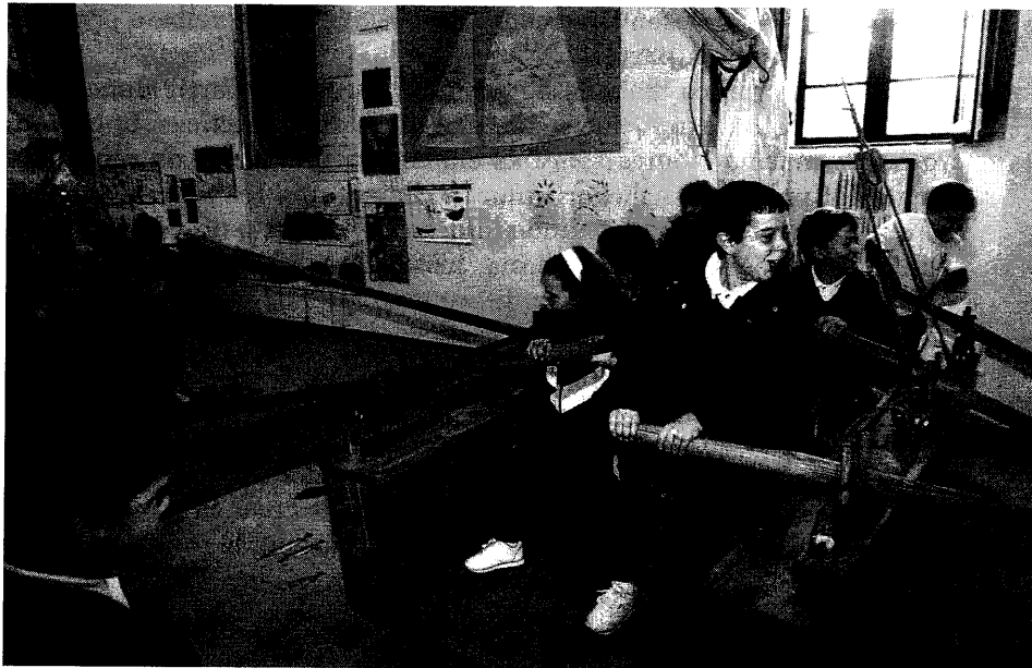
Os participantes no obradoiro comprobaban que remar en equipo non é tan doado

alumnos debían mover os peixes mediante o cordel mentres outros trataban de collelos coas figas tratando de non moverse, como se se encontrasen na cuberta dun barco.