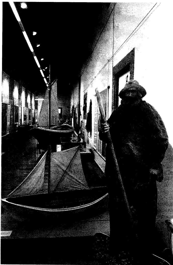
Vista da sección islandesa da exposición

Avignon, Bergen, Bolonia, Bruxelas, Helsinki, Cracovia, Praga, Santiago de Compostela e Reykjavik. Esta Capitalidade Cultural compartida favoreceu a coordinación de programas e proxectos comúns. Nesta liña de colaboración, a cidade de Reykjavik propuxo en 1997 a realización dunha mostra itinerante en torno ó Atlántico Norte como espacio compartido e ás relacións económicas, culturais e pesqueiras establecidas polos habitantes desta longa e común fachada.