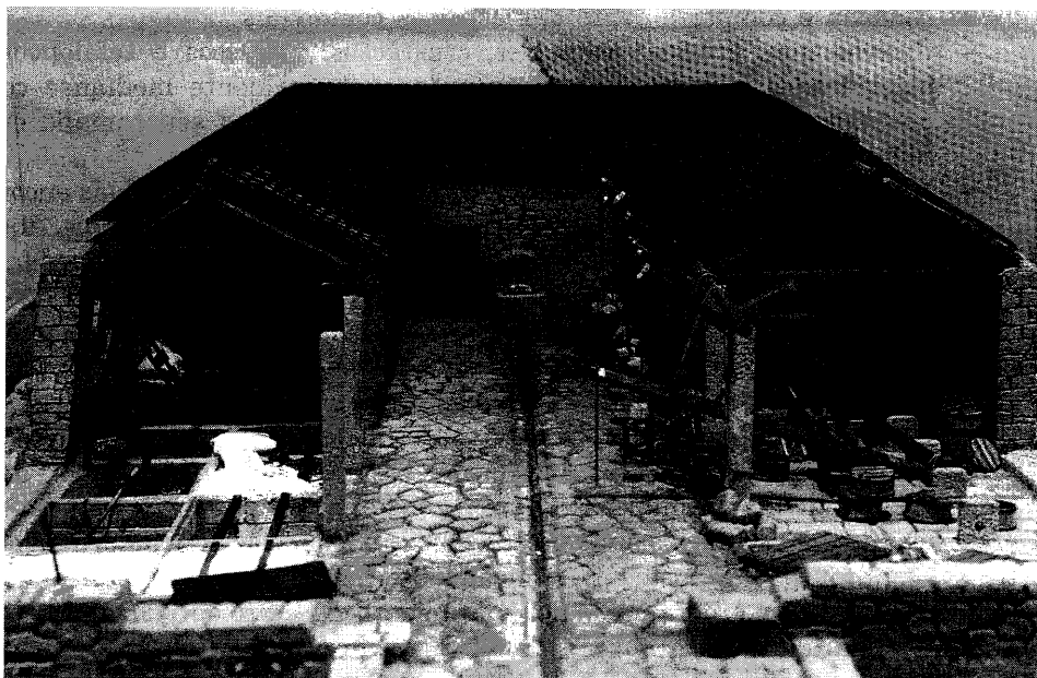
Reproducción dun antigo salgadoiro de sardiña, moi común na costa galega no século XIX

Un dos resultados máis interesantes do proceso de preparación da exposición foi precisamente esa cooperación entre o Museo do Pobo Galego e as empresas, que permitiu ter acceso a pezas, fotografías e outros materiais, moitas veces non suficientemente valorados nin coñecidos, sequera polos seus propietarios. Gracias a Vivir no Atlántico Norte saíron á luz, procedentes de sotos e almacéns, arquivos non utilizados, fotografías inéditas e incluso unha das máis antigas películas de tema pesqueiro-industrial rodada en España. Trátase dun documental de José Gil, o principal pioneiro do cine en Galicia no primeiro tercio do século XX, que recolle diversas imaxes da actividade das empresas viguesas La Artística e Alonarti , dedicadas á produción de envases, maquinaria para a industria conserveira, litografado... así como numerosas escenas sobre a cidade e as actividades pesqueiras. A cinta foi restaurada polo Centro Galego de Artes da Imaxe e estreada no Museo do Pobo Galego durante o período de permanencia da exposición.