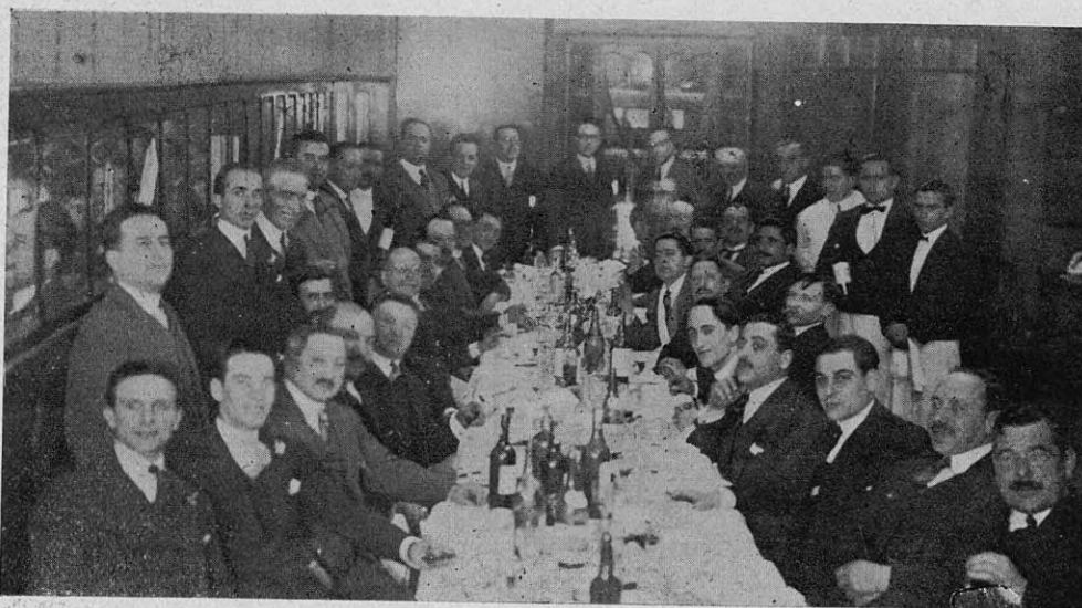
Un grupo de concurrentes al banquete, espera, pacientemente, el fognazo indiscreto del magnesio...

nuestro vivir cotidiano, que asume tan variadas y cromáticas alternativas. El cronista quiere reflejarla con la mayor fidelidad posible, pero apremiado por el espacio tiránico, no sabe si podrá dar a sus expresiones esa cálida emoción de alegría afectiva que se trasuntaba de todos los que rodeaban a nuestro queridísimo amigo.