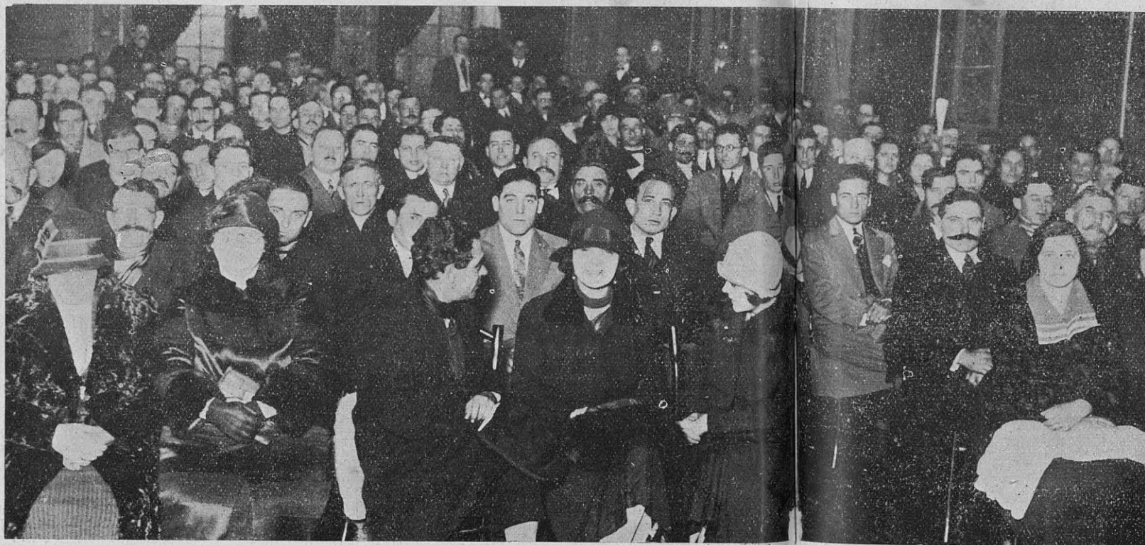
Esta vista parcial, dará a nuestros lectores, una idea aproximada del grandioso aspecto que ofrecía el salón de la Patriótica Española, en la noche de la conferencia

blico recogió con muchos y prolongados aplausos.