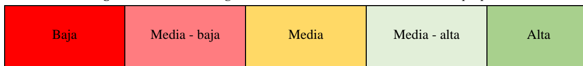
Figura 2. Evaluación según la Declaración STROBE. Elaboración propia.

De igual forma que se hizo con el método CASPe, para facilitar la evaluación de calidad de los estudios transversales seleccionados, se elaboró la leyenda que se muestra en la Figura 2.