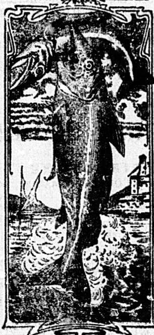
La última palabra

Emulsión "Dos pescados" (Marca registrada.)