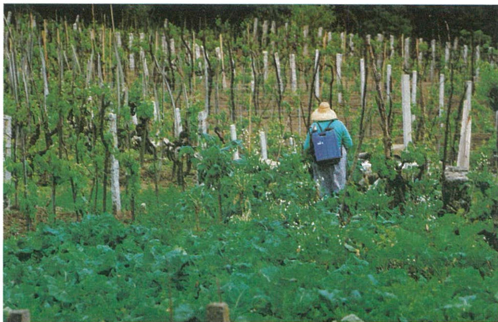
Los viñedos ocupan la mayor parte de la superficie agrícola

detectan iniciativas empresariales significativas. Tan sólo una pequeña empresa de construcciones metálicas, algunos talleres y un reducido sector comercial y de servicios completan el sistema productivo del municipio.