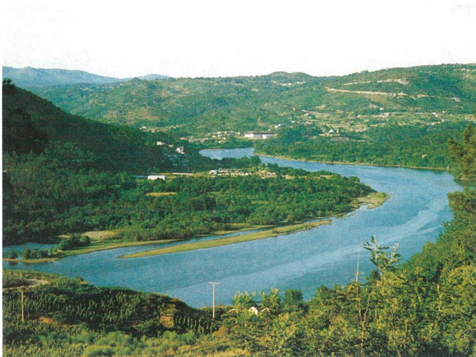
El río Miño a su paso por Barbantes

Lorenzo. Allí está el santuario de San Benito (1751), sin duda uno de los más importantes de todos los que existen en el Ribeiro en honor a dicho santo.