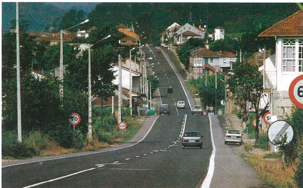
Carretera N-120, principal eje de comunicaciones del municipio

graníticas que se combinan con los amenos valles fluviales de los ríos Avia y Miño. De esta manera, el medio físico del término se organiza en torno a dos unidades morfológicas. La primera aparece constituida por un nudo montañoso que se extiende por la parte central del municipio. Aquí se encuentran las alturas más significativas, destacando los montes de Piñeiro (477 m), A Corredoira (489 m), Nazara (415 m) y los de Torcuato y San Breixo. Ya hacia el Sur, a medida que se descende en altitud, nos encontramos con la segunda unidad morfológica, que ocupa las tierras más bajas y fértiles dispuestas en torno a los valles del río Miño y Avia. Estos dos cursos fluviales, junto con los pequeños arroyos de Lentille, Lama, Fareixina y Farcixo, constituyen las principales redes hídricas con que cuenta el municipio.