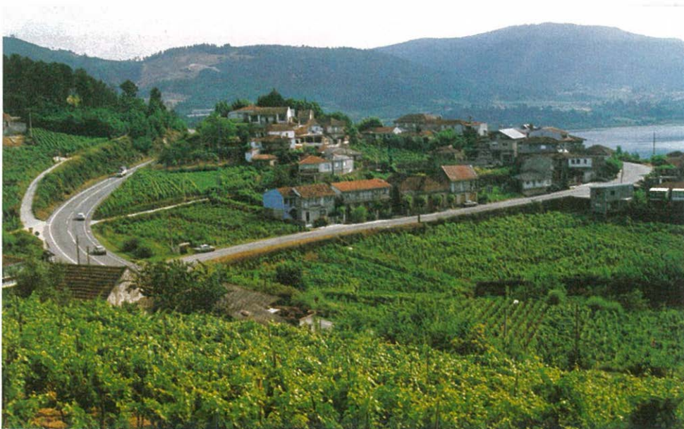
Vista general del núcleo de Xubin

Fuera del sector primario, que todavía ocupa al 97,2% de la población activa, apenas se