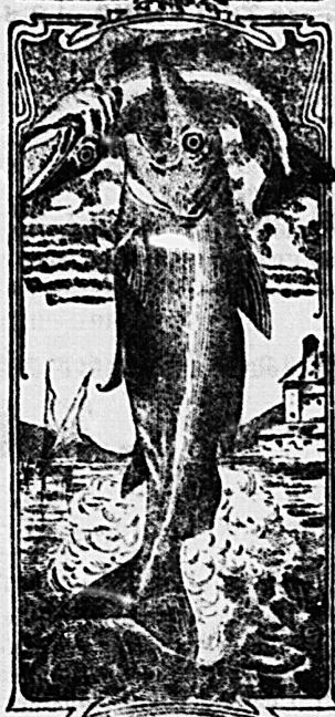
La última palabra

Nos referimos a una nueva y excelente preparación de Emulsión DOS PESCADOS (marca registrada) la que compete con todas, las extranjeras y españolas, tanto en calidad como en precio.