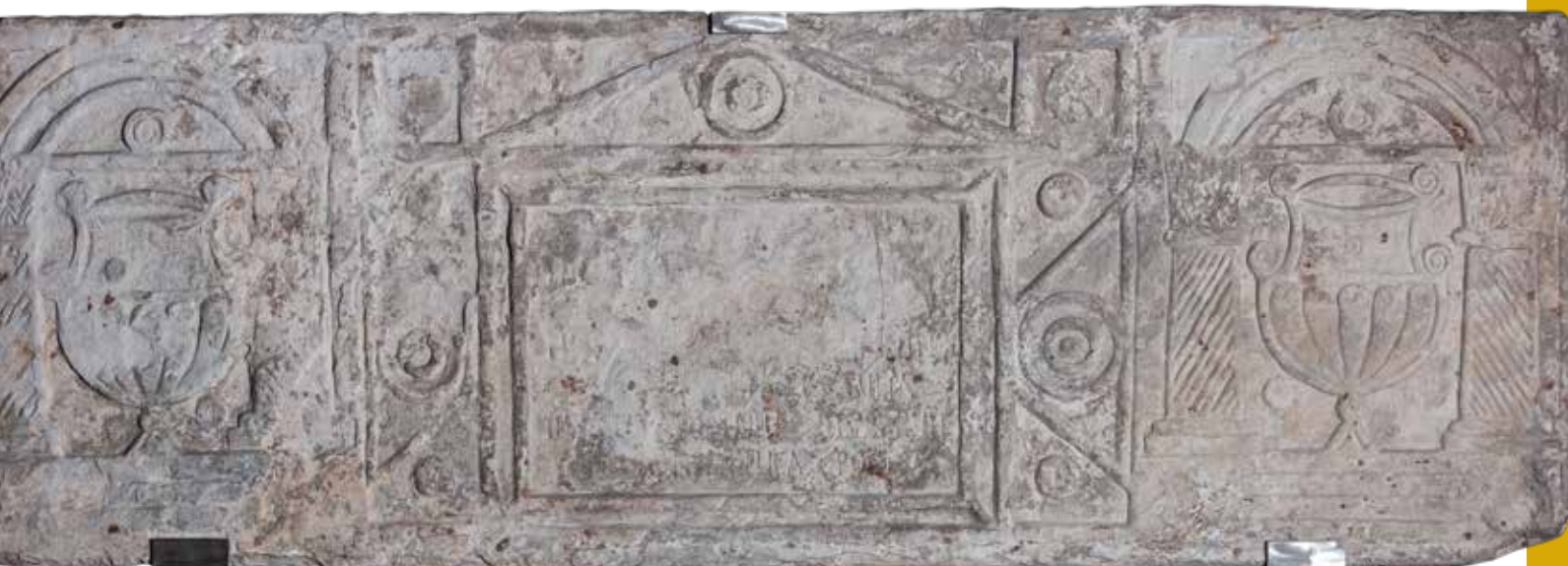
Sartego de Portosín / Sarcófago de Portosín, s. V 215 x 73 x 6 cm Parroquia de San Sadurniño de Goiás Portosín (Porto do Son) Arcebisado de Santiago

También son estos escritos los que nos permiten realizar el seguimiento de un episodio llamado a alterar el equilibrio de poder en la región: la llegada de los pueblos germánicos -aunque no todos lo fuesen- a comienzos del siglo V d. C. Tras un momento inicial caracterizado por las sucesivas razzias y pillajes, el líder de los suevos, Hermenerico, acordó una alianza con los romanos por la que se le permitía asentarse en la zona occidental de la provincia de Gallaecia . Este hecho dio lugar a la creación del primer reino ( regnum ) germánico de Occidente. Puesto que no eran muchos (unos treinta o cuarenta mil, según estimaciones actuales), los suevos optaron por asentarse principalmente en la zona meridional del territorio, cerca de Braga. Como cabía esperar, a buena parte de la aristocracia galaicorromana no le pareció bien la nueva situación, acostumbrada como estaba a hacer y deshacer a su antojo sin tener que dar demasiadas explicaciones.