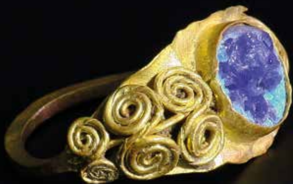
Anel das Travesas / Anillo de As Travesas Época romana Ouro / Oro Colección Visible do Castro das Travesas

A medida que o estado romano se desintegra polas loitas internas e as presións externas, nos salóns destas residencias fráganse unións e pactos de familia, acádanse importantes acordos políticos e, grazas á contratación de escoltas e exércitos privados, ofrécese unha ilusión de protección aos máis desamparados... lóxicamente por un prezo abusivo. Fálase, e moito, de relixión. De Oriente proceden novos cultos e divindades, pero o cristianismo está chamado a impoñerse sobre todos os demais, especialmente desde o seu recoñecemento tácito como relixión de estado durante o reinado do emperador Constantino (306-337 d. de C.). Non obstante, nestes instantes existen distintos dogmas dentro da mesma fe. Optar por un en concreto supoñía estar disposto a tomar partido político con todas as súas consecuencias, tal e como lle ocorreu aos seguidores do reverenciado Prisciliano. Co andar do tempo, os vellos deuses foron desaparecendo dos espazos de poder, sobrevivindo nas crenzas das xentes do rural. Nos textos dos apologetas e teólogos do primeiro cristianismo atopamos o secular eco dos esforzos por erradicar os ritos destes «aldeáns» (pois pagáns son os habitantes do pagus ou aldea).