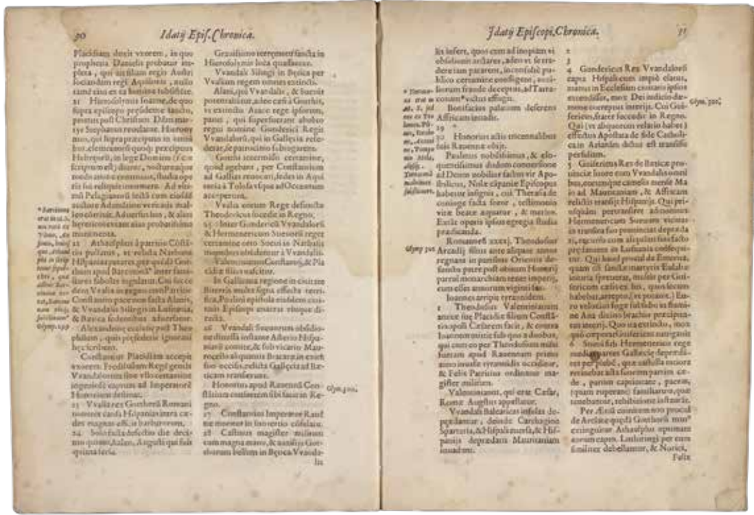
Historias de Idacio obispo que escriuio poco antes que España se perdiere, de Isidoro obispo de Badajoz ... de Sebastiano obispo de Salamanca ... de Sampiro obispo de Astorga ... de Pelagio obispo de [...], 1615 Prudencia de Sandoval (1551?-1620) Biblioteca Nacional de España

Loxicamente, había quen pensaba que un débil emperador sentado no distante trono de Roma sería sempre preferible a un belicoso rei con base en Braga. Idacio de Chaves (bispo, cronista, peregrino a Terra Santa e fillo de alto funcionario imperial) estaba indubidablemente entre eles. Paulo Orosio (quen paradoxalmente tivera que fuxir precipitadamente da Península cara a África por mor dos invasores), non o vía así. Antes ben, a chegada dos suevos permitía quitar de enriba o pesado xugo impositivo romano e negociar unhas vantaxosas condicións cos novos señores. Malia a disparidade de opinións con respecto aos “bárbaros”, semella que todos lle deran bastantes voltas á idea de pagar menos taxas.