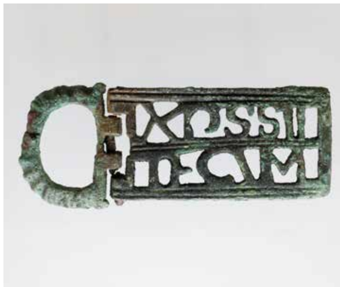
Broche de cinto de Baamorto Visigodo, s. V-VI Bronce, ouro e pasta vítrea Bronce, oro y pasta vítrea 10,7 x 6,4 x 1,2 cm RMP. Museo Provincial de Lugo