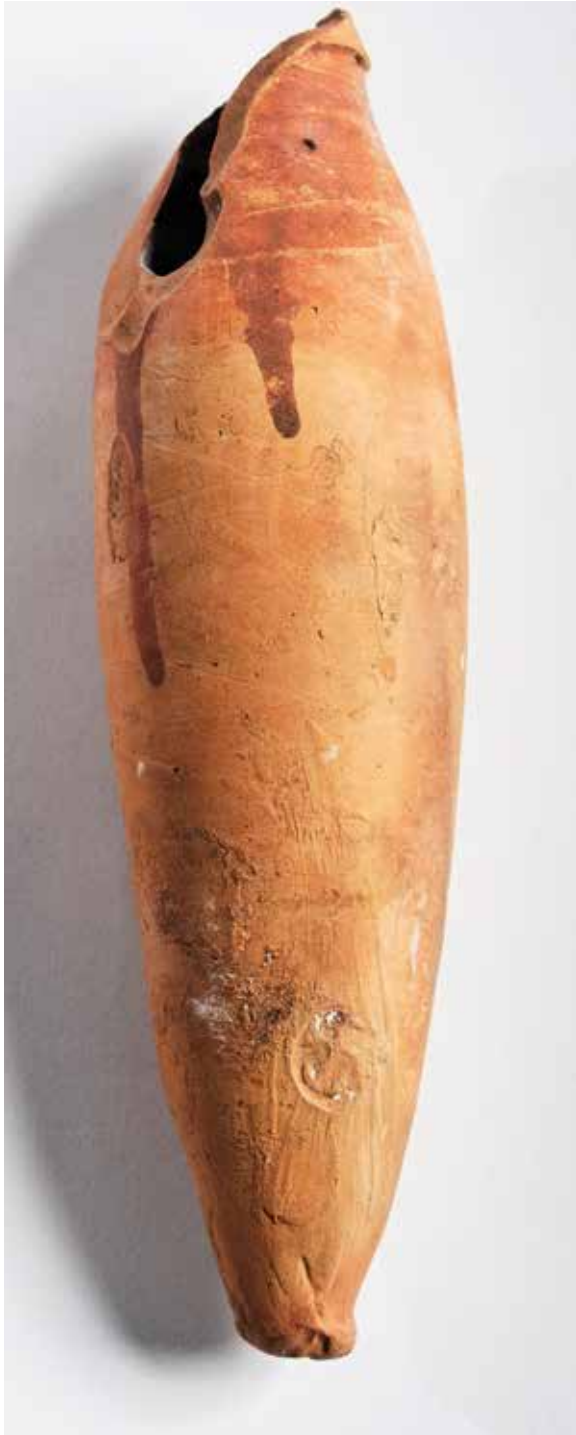
Ungüentario S. VI-VIII Cerámica oxidante / 17 x 5 cm Museo do Mar de Galicia

Estes unguentarios, contemporáneos de Exeria, empregábanse para traer óleos de Terra Santa á volta das peregrinacións.