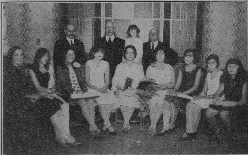
COMISIÓN DEL INSTITUTO CULTURAL: PROFESORA Y ALUMNAS DE PIANO Y SOLFEO DEL CONSERVATORIO.

Como presidente de este instituto cultural del Centro Gallego, os doy las más efusivas gracias, rogándoos que, al aceptarlas, perseveréis con nosotros en alcanzar los nobilísimos fines que perseguimos: fines de cultura general, tan necesaria para fortalecer los lazos de fraternidad que nos unen, como pa-