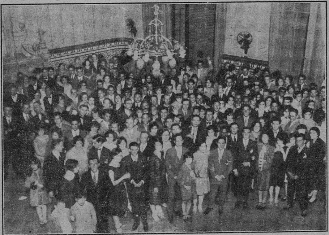
PARTE DE LA CONCURRENCIA AL BAILE DEL 29 DE ABRIL EN NUESTRO GRAN SALÓN DE ACTCS.

En verdad, señoras y señores, que el Instituto Cultural del Centro Gallego de Avelaneda, se dá por largamente pagado con ese tributo espiritual.