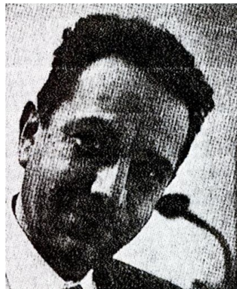
Figura 3: Arthur Milgram

Arthur Norton Milgram (1912-1961) foi un destacado matemático estadounidense. Milgram destacou polo seu traballo na teoría dos números e na análise matemática. É sabido que Milgram formulou varios teoremas que lle permitiron avanzar no coñecemento matemático e que as súas investigacións axudaron a comprender e resolver problemas matemáticos fundamentais, deixando unha pegada duradeira na disciplina. Faleceu tan só seis anos despois da publicación do teorema.