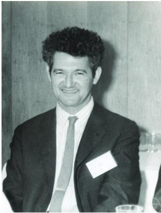
Figura 1: Peter D. Lax