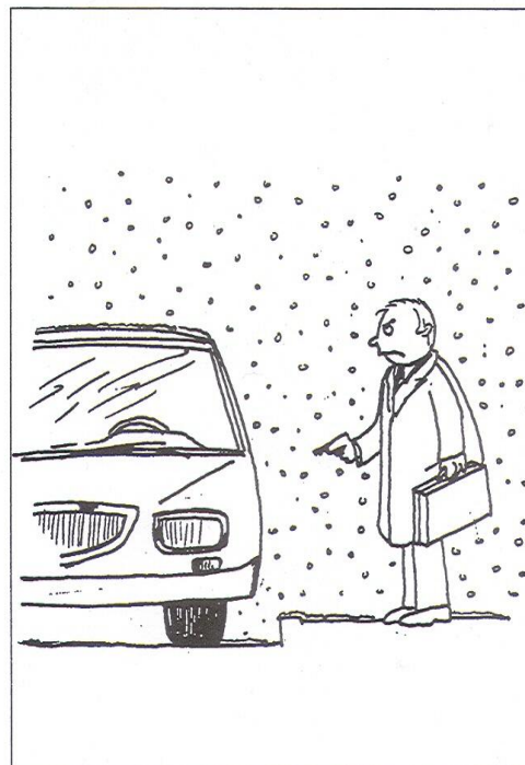
FIGURA 2. VIÑETAS-ESTÍMULO DE COMPRESIÓN DE EMOCIONES (MONFORT 2002)