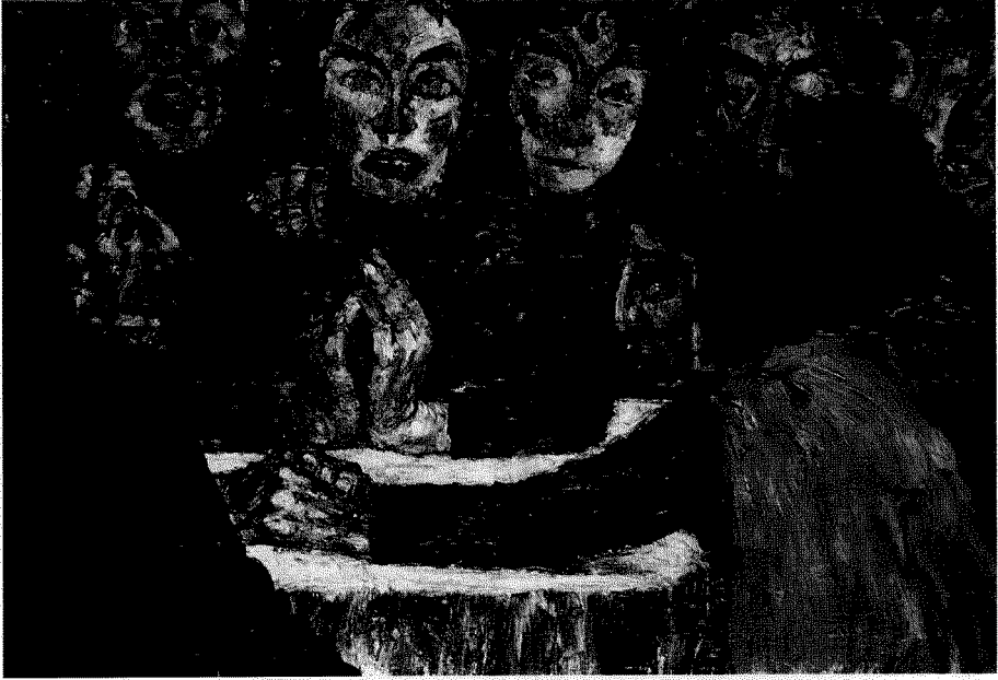
Fig. 9. Emil Nolde: Pentecostés (1909).