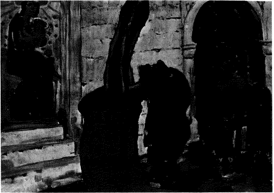
Fig. 10. Emil Nolde: parte del tríptico de Santa María Egipcíaca (1912).