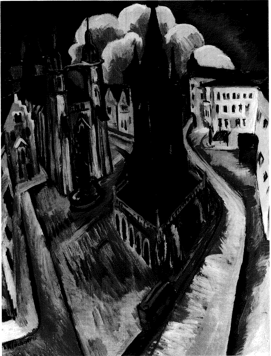
Fig. 4. Ernst Ludwig Kirchner: La torre roja de Halle (1914).