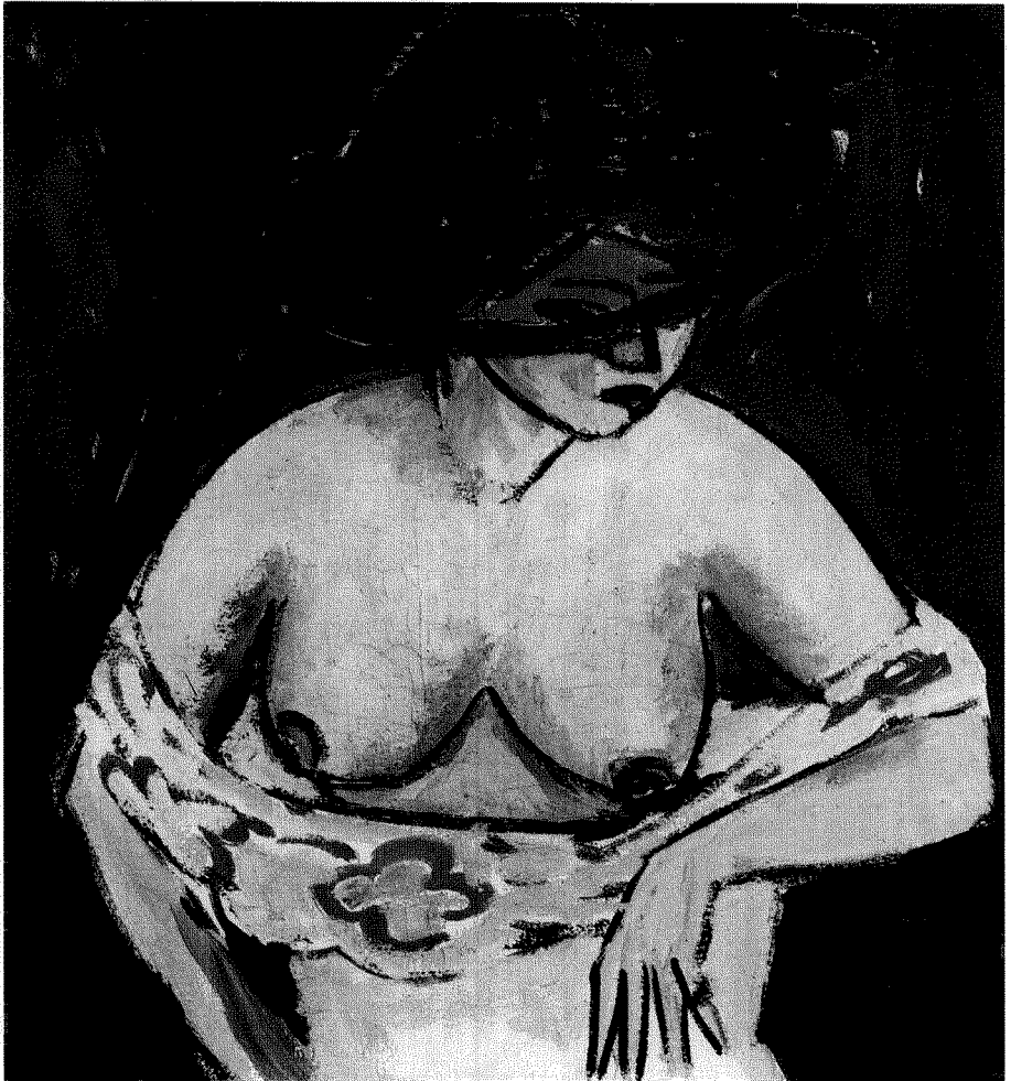
Fig. 8. Ernst Ludwig Kirchner: Busto de mujer con sombrero (1911).