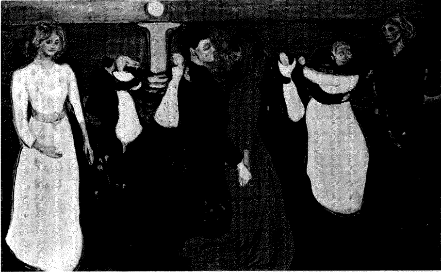
Fig. 3. Edvard Munch: La danza de la vida (1899).