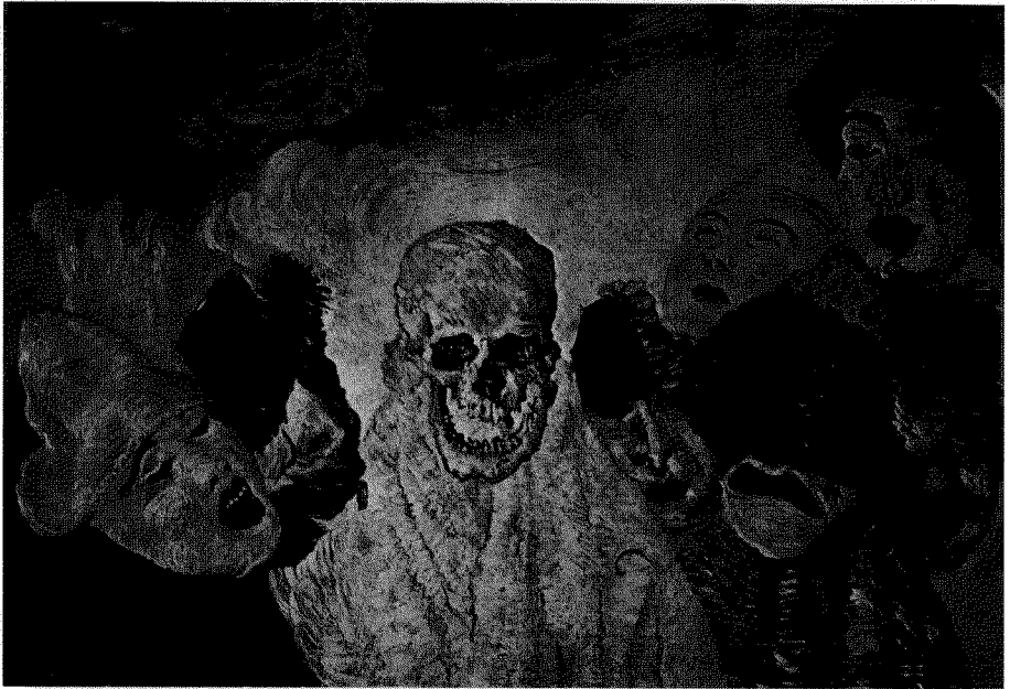
Fig. 6. James Ensor: La muerte y las máscaras (1897).