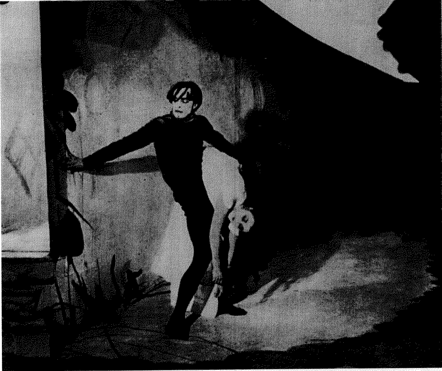
Fig. 1. Robert Wiene: El gabinete del Dr. Caligari (1919).