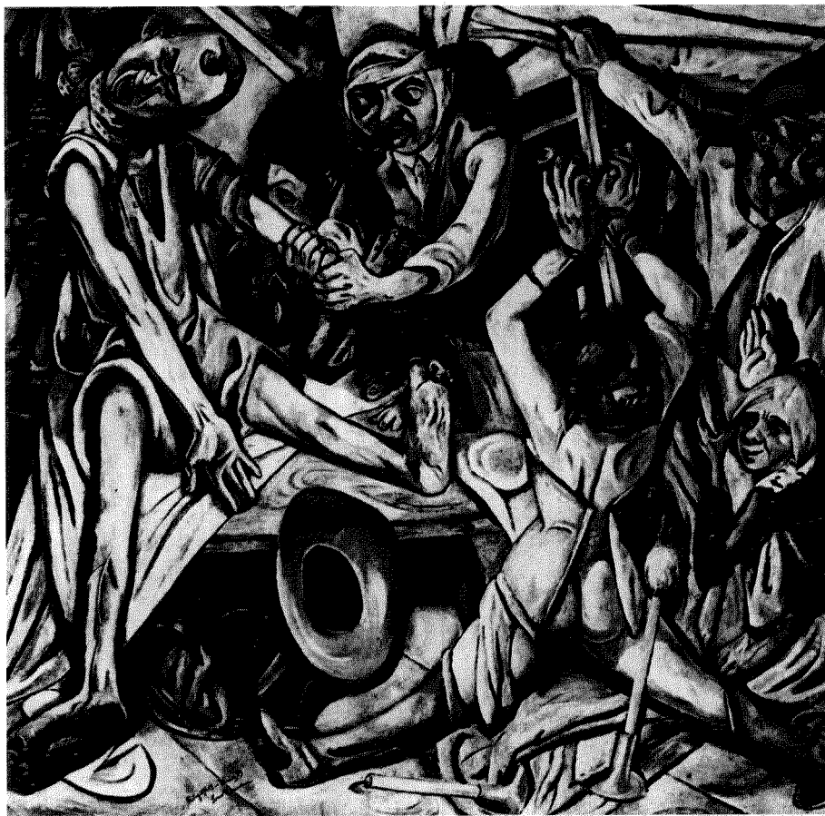
Fig. 7. Max Beckmann: La noche (1918).