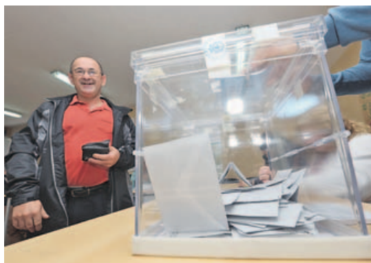
Una de las mesas electorales de Carballo.

Hace cuatro años, la formación de Evencio Ferrero ya había consolidado ese dominio en el núcleo del municipio, pasando del 50 % de apoyos en varias de ellas, algo que hasta el 2011 no había ocurrido nunca. El domingo no solo pasó eso, sino que en varias urnas superaron el 60 % de papeletas, otro hito. El mejor registro en términos absolutos lo consiguieron esta vez en el Fórum, donde los nacionalistas se quedaron esta vez a un solo voto de los 300 sufragios. En una de las