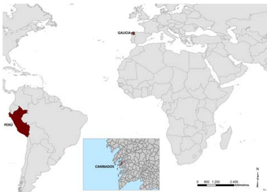
Figura 1. Localización del área de estudio.

Desde el punto de vista metodológico no se hizo un análisis del discurso (AD), entendido este como una interpretación sistemática del discurso oral puesto que se partía de la existencia de un guión semi-estructurado que permitía un vaciado de aquellos elementos representativos sin necesidad de acudir a las técnicas propias del AD.