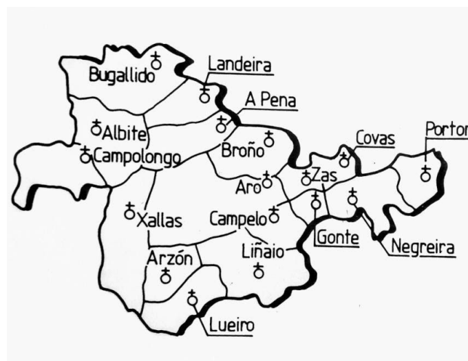
Figura 1. Mapa parroquial do Concello de Negreira. [imaxe dixital]. Extraída de Consellería de Educación e Ordenación Universitaria, 1989.

Seguindo a entrada de Lois (2006) na Gran Enciclopedia Galega , localizamos o concello de Negreira ao oeste de Santiago de Compostela, limitando ao N. con Santa Comba e A Baña, ao S. con Brión, ao O. con Mazaricos e Outes e ao L. con Ames. O concello ten unha superficie de 115,1 km 2 e está composto por 18 parroquias -Alvite, Aro, Arzón, Broño, Bugallido, Campelo, Campolongo, Covas, Gonte, Landeira, Liñao, Logrosa, Lueiro, Negreira, A Pena, Portor, Xallas e Zas- sendo a capital do concello a vila de Negreira, cunha situación estratéxica, sobre o río Tambre, que a fai ser o centro comercial da comarca da Barcala. Podemos ver a súa distribución no seguinte mapa: