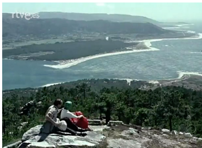
Figura 3. Observando el paisaje desde el monte Tegra

Plantear el cine de correspondencia como una sucesión de fotografías fílmicas de Galicia tiene el sentido del tiempo atrapado en el plano filmado. Por eso Manuel Arís, e incluso los operadores de NO-DO, usan la cámara más como fotográfica que como cinematográfica. El tiempo fotográfico permite ralentizar el cinematográfico —el tiempo que se escapa ante los ojos— facilitando la recreación afectiva al ver un territorio congelado en un eterno presente que espera por el retorno. Pero, además, la cámara de cine, por ser dinámica, tam-