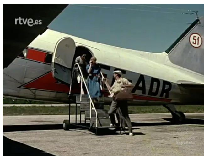
Figura 4. El emigrado y su mujer llegando a Galicia

Por último, hay un territorio que cumple una función distinta de la turística: Vigo. La ciudad de Vigo se narra después de aquella llegada en avioneta, así que es la primera en figurar en la narrativa y su uso no opera desde lo turístico sino desde la legitimación. El emigrado turistificado se convierte en Vigo en un emigrado legitimador del régimen. Su recorrido por la ciudad no existe más allá de un paseo por el puerto. A mayores, se presentan planos de la lonja y del interior de fábricas y astilleros que probablemente habrían sido filmados por operadores de NO-DO en cualquier otra circunstancia, pues la pareja no aparece en las escenas interiores. Una locución nada acomplejada describe con detalle los avances y desarrollos de la ciudad de Vigo como ejemplo del impulso eco-