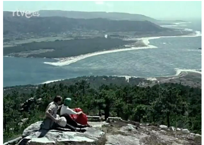
Figure 3. Viewing the scenery from Mount Santa Tegra

Correspondence cinema can be considered a series of filmic photographs of Galicia in the sense that time is trapped in each film shot. This is why Manuel Arís and even the camera operators