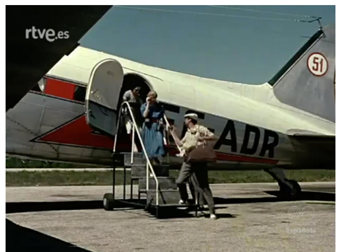
Figure 4. The émigré and his wife arriving in Galicia

There is one location in the film that fulfils a function other than tourism promotion: Vigo. The city of Vigo is shown after the arrival on the small aircraft, making it the first city to appear in the story, and it serves not as a tourist attraction but as a means of legitimising the Franco regime. In Vigo, the émigré as tourist becomes an émigré as legiti-