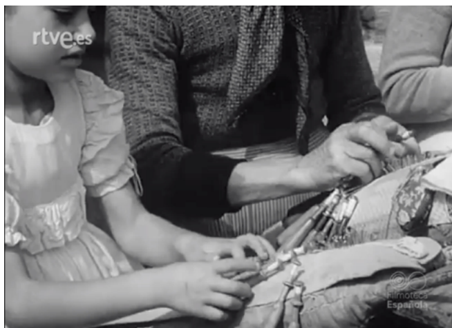
Figura 2. Mujeres palillando, Galicia y sus gentes (1951)

El ejercicio violento de la construcción de una subjetividad inventada y sobre todo despolitizada, se produce también en las dos mujeres solteras que hacen senderismo en el Reportaje en Ansó o en la dominación masculina que implica la relación vertical que se establece entre el hombre y las dos mujeres subjetivadas como becarias en De Yuste a Guadalupe . Lo que hace que Aires de mi tierra sea un documental perverso y violento es que el sujeto al que se le roba la voz es un emigrante; un subalterno. Y es la única película que utiliza un conflicto social y político como un cliché o arquetipo folclorista para vender turismo.