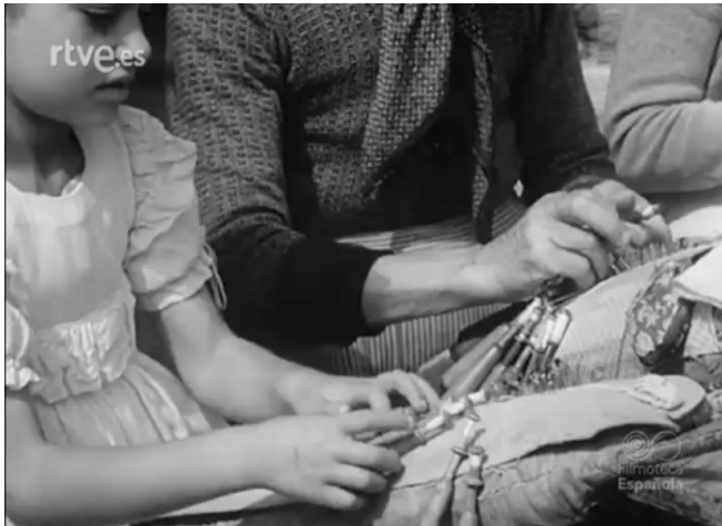
Figure 2. Women making lace, Galicia y sus gentes (1951)

depoliticised subject stripped of drama, of a past and a present (the subject's historical experience), which is used not only to promote the region to tourists but also to legitimise the Franco regime as the architect of regional development. It constructs a tourist who legitimises developmentalism by means of the invented discourse of an émigré on a visit to his homeland who then returns to Latin America. The émigré and his social status are touristified through the film, converting him into a tourist in the same way that the women's branch of the Francoist Falange, Sección Femenina, converted the woman sewing Galician lace inside her house in Costa da Morte into a "housewife" (Jiménez-Esquinas, 2021: 156; Mies, 2014).