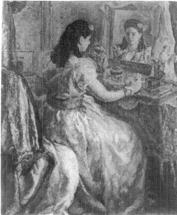
Ante el espejo , óleo de Juan Luis. (Col. Angel Echeverri).