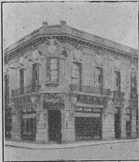
Casa Matriz, Brasil 1301 Sucursal, Alsina 1499

Casas las mejor surtidas en calzado de todas clases y con un selecto stok en novedades y fantasías para la presente estación