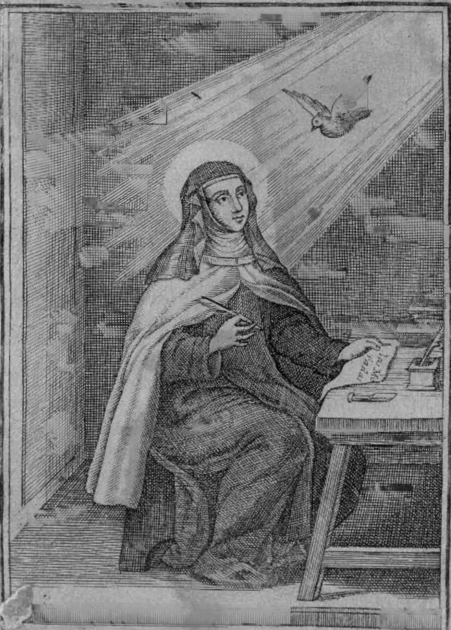
SANTA TERESA DE JESVS Doctora Mystica Natural de Avila