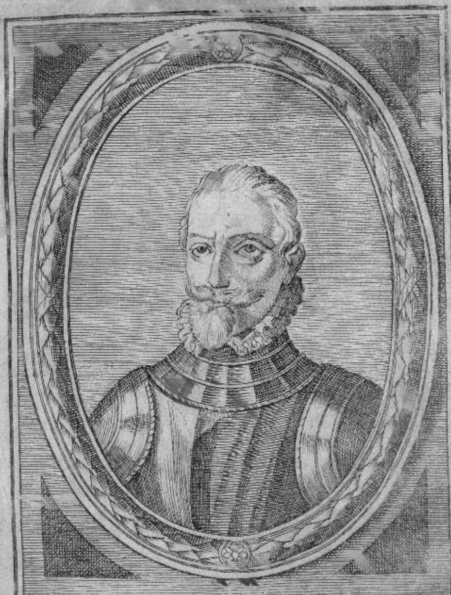
SANCHO DAVILA En oposizion al Conde Ludovico de Nasao, de- fiende los Estados de Flandes.