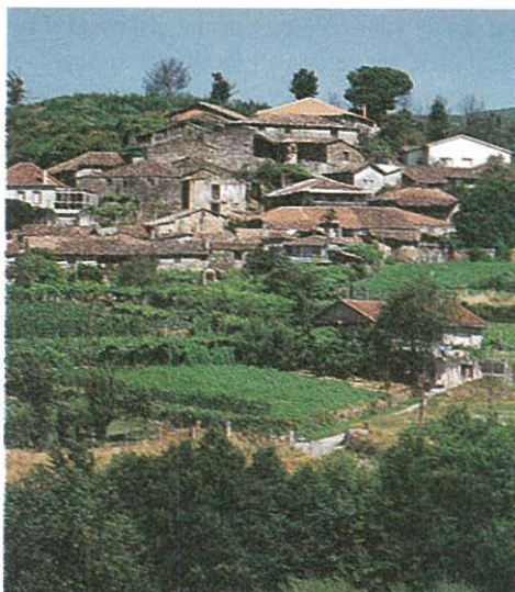
Aldea de A Pousa en Vilarrubín

Por lo demás, señalar que el escaso volumen de habitantes y la propia cercanía de la capital provincial impiden la expansión local del sector comercial y de servicios. A ello contribuye la sistemática e intensa salida de jóvenes hacia Ou-