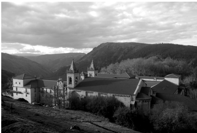
Figura 1. Santo Estevo de Ribas de Sil, Nogueira de Ramuín, Ourense. Vista exterior.

En el siglo X una lista de nueve obispos santos 4 abandonarán su sede sucesivamente para dedicarse a una vida contemplativa y de oración en este místico espacio. Sus sepulturas acabaron dando origen a uno de los focos de peregrinación más importantes de la Edad Media, de ahí que las dependencias monacales fuesen continuamente renovadas en función de las necesidades de la congregación.