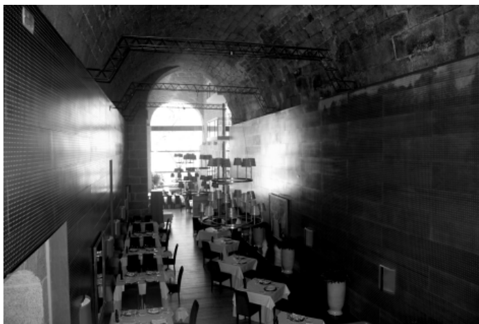
Figura 4. Restaurante de Santo Estevo de Ribas de Sil, según el proyecto de 1999, realizado por A. Freixedo Alemparte y J. Suances Pereiro.

El salón de actos que antes se encontraba situado en el ala norte, se traslada con todo su equipamiento 27 a la zona este. De esta manera, las dependencias del hotel se despliegan por el resto del antiguo cenobio, proyectando las mínimas aberturas posibles de nuevos huecos en la antigua fábrica del inmueble. Así, en el ala oeste se hallan las estancias dedicadas a comedor, salón, terraza-cafetería, cocina, oficio general, bodega, lavandería, vestuarios, aseos y sala de personal.