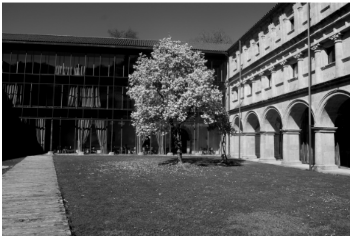
Figura 5. Lienzo norte del Claustro Grande de Santo Estevo de Ribas de Sil según la solución adoptada en el proyecto del año 1999 por A. Freixedo Alemparte y J. Suances Pereiro.

Si ya per se la titularidad del monasterio había pasado por diferentes manos a lo largo de su historia, la cesión al Estado del inmueble por la Xunta de Galicia para que se incluya en la red de Paradores de Turismo de España, el 7 de julio de 2004 viene a aumentar la complejidad del estudio de la propiedad del antiguo cenobio. La Diócesis de Ourense se había reservado, como comentamos anteriormente, la propiedad de la Iglesia y la casa rectoral, con