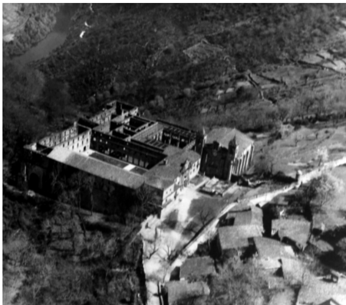
Figura 2. Estado de ruinoso de Santo Estevo de Ribas de Sil anterior a las intervenciones de Pons-Sorolla en los años 50, Archivo Municipal de Nogueira de Ramuín.

En 1968, Pons-Sorolla redacta sin colaboradores dos nuevos proyectos donde se empieza a trabajar con el Claustro Grande: el de “Restauración de galerías claustrales y cubiertas del Monasterio en zonas destinadas a Escuelas Municipales”, dedicado a la consolidación de galerías en costados Poniente y Mediodía, con nueva cubierta y tejado del Claustro Grande; y el de “Obras de conservación en el Monasterio de San Esteban de Ribas de Sil” para la reposición de forjados y cubiertas de la misma zona y el atado de muros de la fachada Oeste del Claustro Grande.