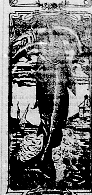
La última palabra

Nos referimos a una nueva y excelente preparación de Emulsión "DOS PESCADOS" (marca registrada) la que compete con todas, las extranjeras y españolas, tanto en calidad como en precio. Depositarios: por menor, Farmacia y Laboratorio de Iglesias. Por mayor, Droguería de Iglesias y Compañía.