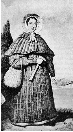
Mary Anning (Inglaterra, 1799– 1847)