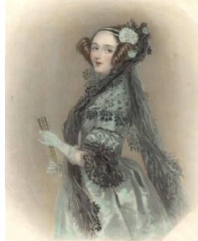
Ada Byron, Condessa de Lovelace (Inglaterra, 1815–1852)