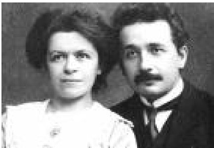
Mileva Maric (Serbia, 1875– 1948)