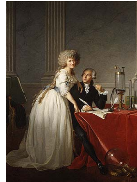
Marie Anne Pierrette Paulze (Francia, 1758– 1836)