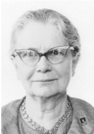
Helen Sawyer Hogg (Canadá, 1905– 1993)