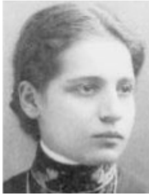
Lise Meitner (Austria, 1878– 1968)