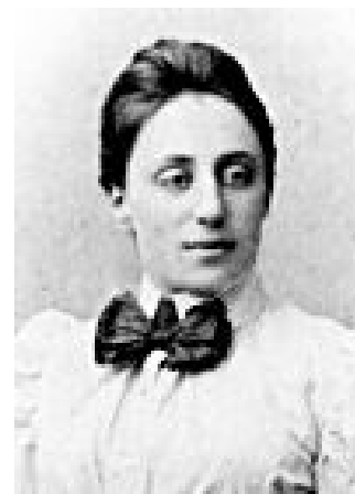
Emmy Noether (Alemania, 1882– 1935)