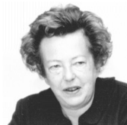
Maria Goeppert-Mayer (Alemania, 1906– 1972)

b) Algunhas carpetas con parte do seu material e cómo acceder á información: