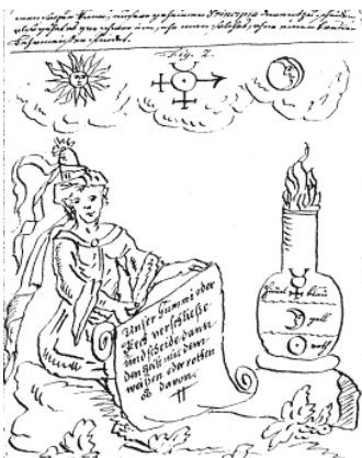
María A Xudea ou A Profetisa