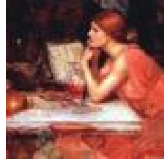
Trótula de Salerno (Italia, ? – 1097)