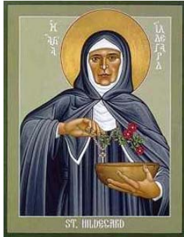
S. Hildegarda de Bingen (Alemania, 1098-1179)