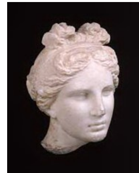
Agnodice (Atenas, 300 a.C)