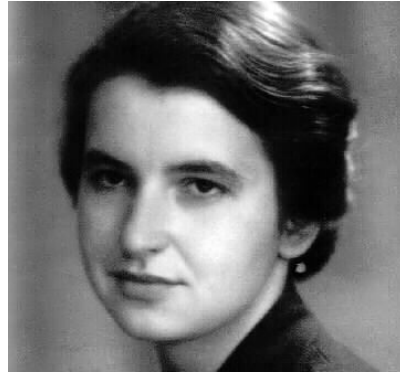
Rosalind Elsie Franklin Inglaterra, 1920– 1958)