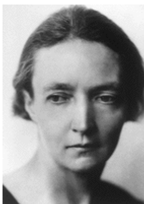
Irene Joliot-Curie (Francia, 1897– 1956)