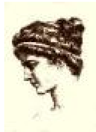
Hipatia (Alexandria, s. 370-415 d.C)