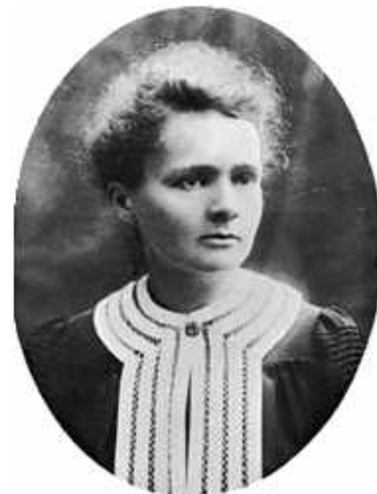
Marja Skłodowska (Marie Curie) (Polonia, 1867– 1934)