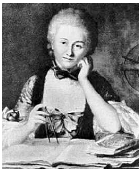
Madame du Chatelet (Francia, 1706– 1749)