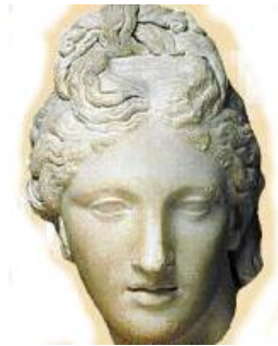
Theano (Grecia, s. VI a. C)