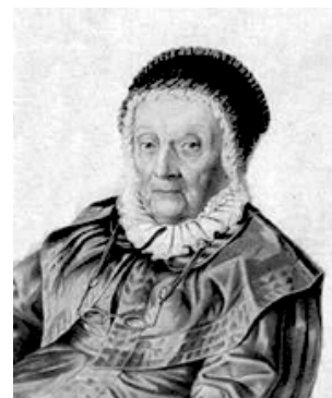
Caroline Herschel (Alemania, 1750– 1848)