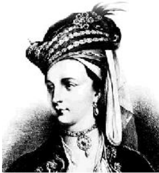
Lady Mary Wortley Montagu (Inglaterra, 1689– 1762)