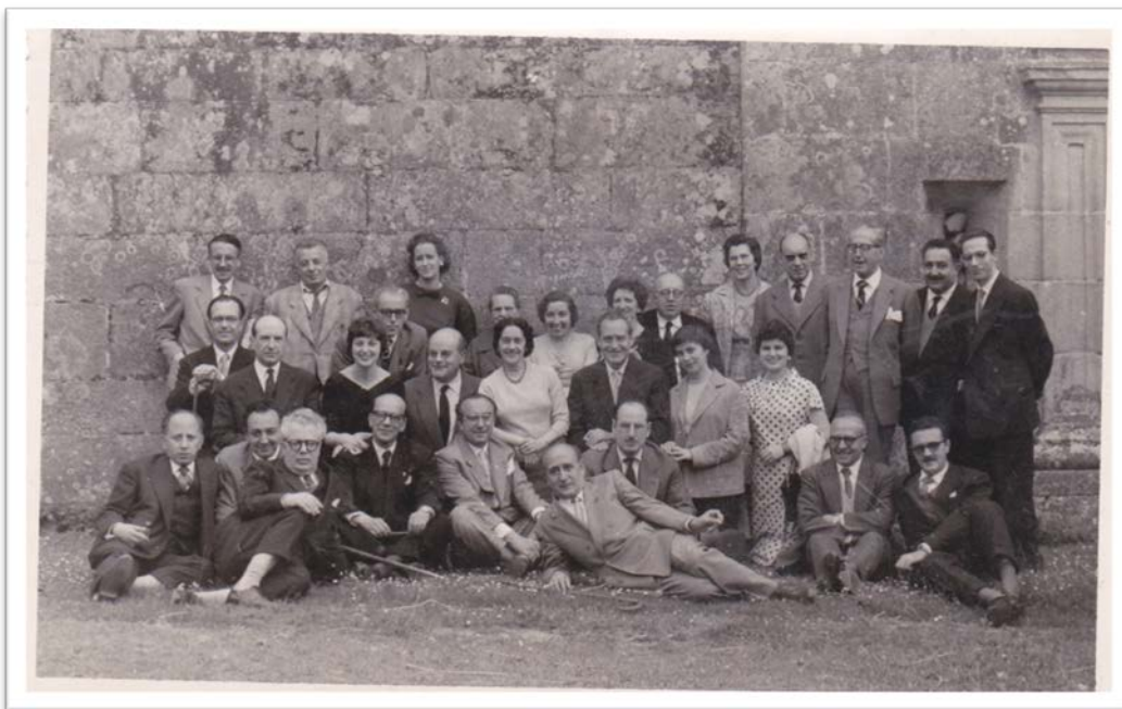
Fotografía 6: Xuntanza no pazo de Otero Pedrayo (Trasalba).