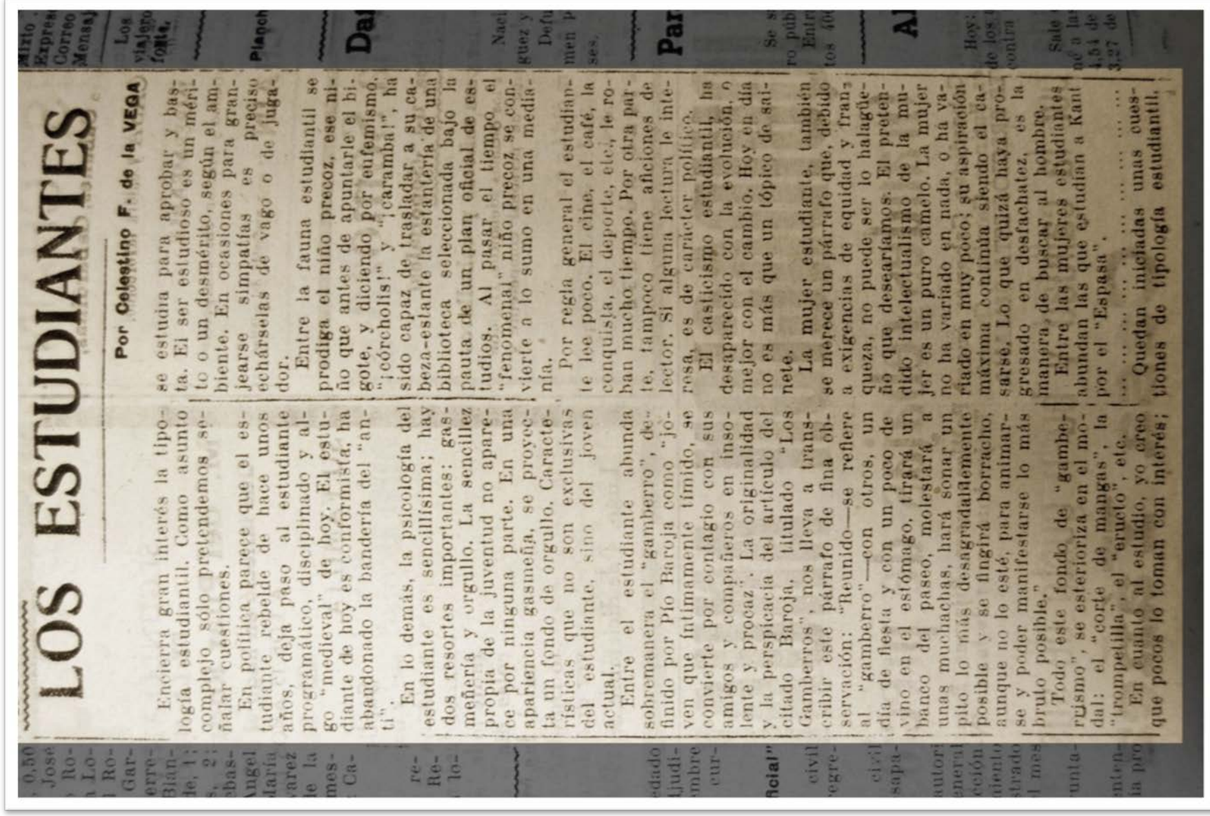
Fotografía 3: artículo titulado Los estudiantes (04/12/1934). O original atópase na Biblioteca Provincial.