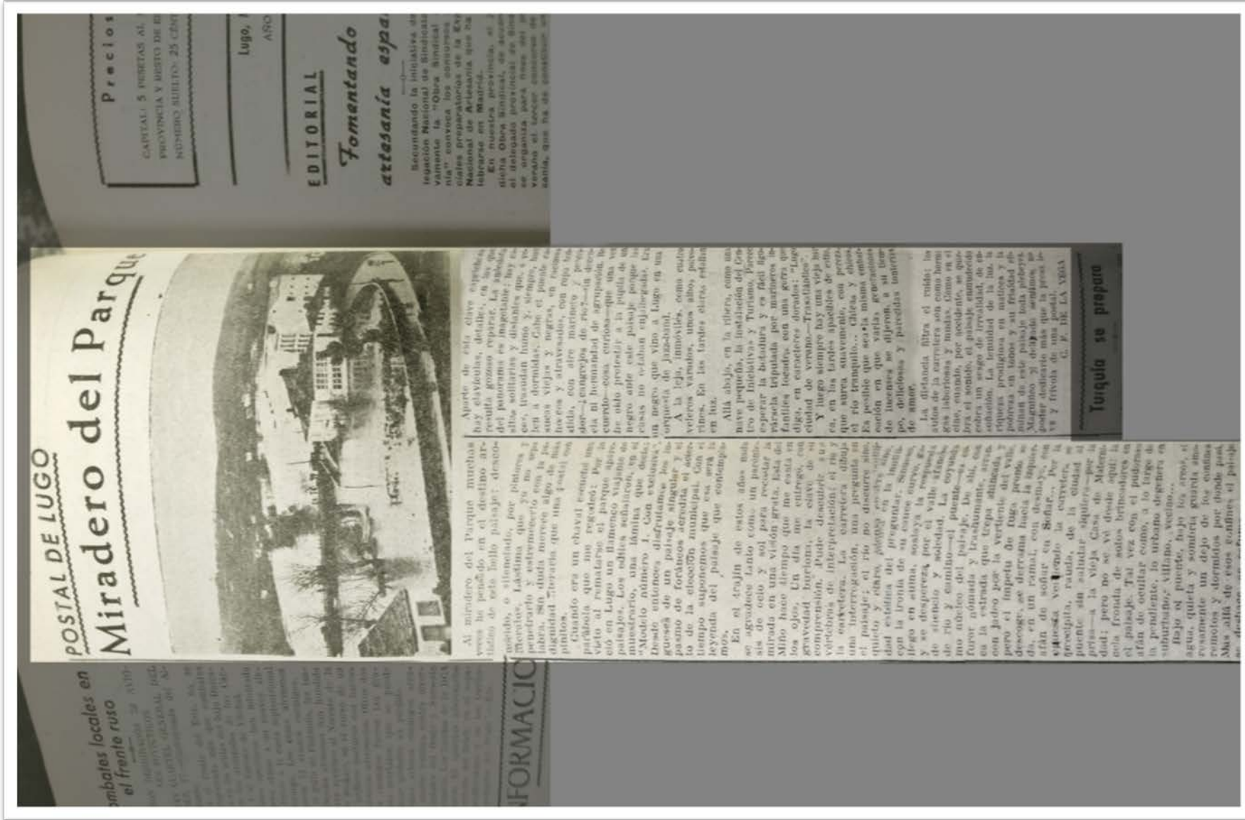
Fotografía 7: artigo titulado Miradero del parque (29/04/1944). A mala calidade da imaxe ven dada pola montaxe de varias fotografías nunha única. O orixinal atópase na Biblioteca Provincial.