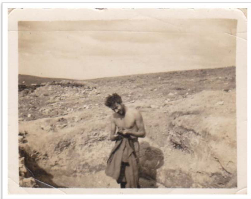
Fotografía 1: CFV no fronte (Guerra Civil)