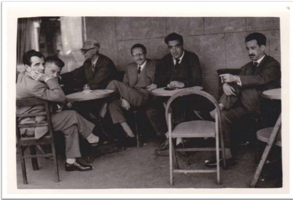
Fotografía 4: CFV participando nun faladoiro.