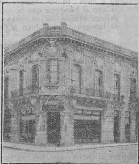
Casa Matriz, Brasil 1301 Sucursal, Alsina 1499

Casas las mejor surtidas en calzado de todas clases y con un selecto stok en novedades y fantasias para la presente estación.