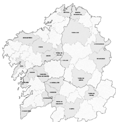
Figura 1.- Localización dentro de Galicia de las comarcas estudiadas

Se denomina Modelo Objetivo de Ordenación Agraria Comarcal a un modelo que, partiendo del análisis del conjunto de los elementos que caracterizan al subsistema agrario en un territorio (medio físico natural, contorno socio-económico, infraestructuras y marco legal), permite una síntesis que define los trazos característicos de la situación actual del subsistema y de los parámetros que marcan su evolución, de manera que, mediante el estudio del modelo, sea posible conocer la situación potencial de la producción agraria en el territorio considerado (De Wit & Van Keulen, 1988, Riveiro et al., 2005).