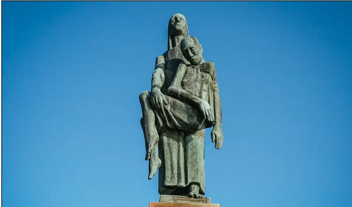
Lambert, Will. “Burdened Woman”. Fotografía extraída de https://berlinexperiences.com/featured_experiences/visit-the-ravensbruck-concentration-camp-memorial/