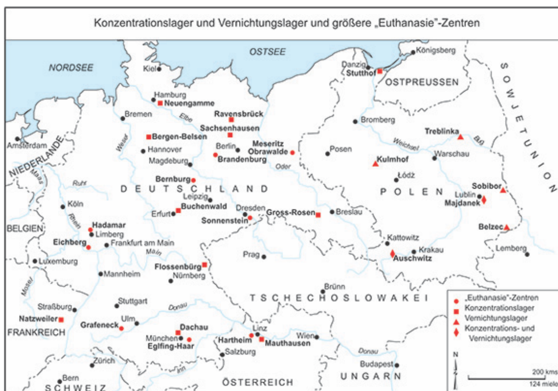
Figura 2: Campos de concentración y de exterminio, y los grandes centros de eutanasia

Noakes, Jeremy. “Concentration and Extermination Camps and Major “Euthanasia” Centers”. Nazism, 1919-1945 . Exeter: University of Exeter Press, 1998, S. 645. https://ghdi.ghi-dc.org/map.cfm?map_id=3432&language=german