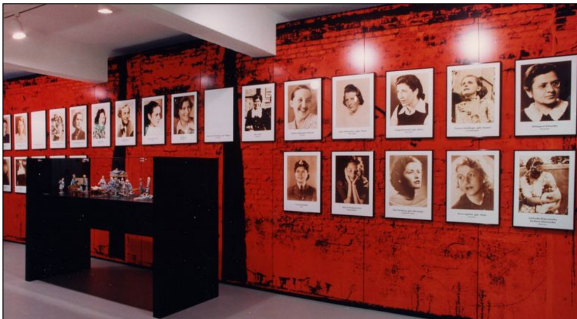
Figura 7: Exposición Permanente del Museo Memorial del Campo de Concentración de Ravensbrück

Mahn und Gedenkstätte Ravensbrück. “Women of Ravensbrück” Segunda parte de la Exposición Permanente del Museo Memorial de Ravensbrück en Since 1993 Memorial Museum Ravensbrück . https://www.ravensbrueck-sbg.de/en/history/since-1993/